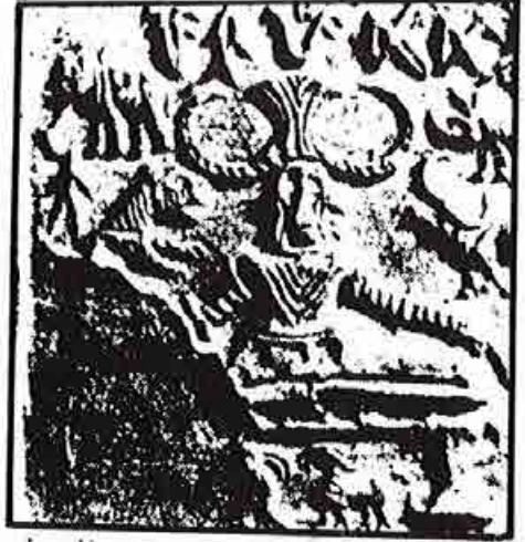
كتابة مجهولة لشعب عاش في وادي السند خلال الالف الثالث قبل الميلاد

واقدم أبداً تتطرق الى ذكر هذه البلاد الغامضة هي لوحة الملك اور - نانشيه (حوالي عام ٢٥٢٠ ق.م) الذي