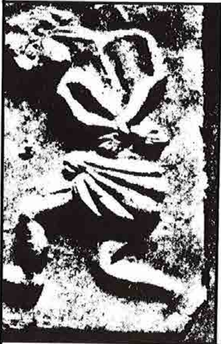
عبد . لوحة فخارية من «موخينجودارو»

وفي عام ١٩٠٦ طلبت السلطات البريطانية في الهند من الكولونيل برادو دراسة تلال المقابر الاثرية في البحرين - وسرعان ما عمد الكولونيل بالأسلوب العسكري الصرف وبمساعدة الجنود ، والعمال العرب الذين اصطحبهم الى نبش اعلى التلال الموجودة قرب بلدة «عالي» ويبلغ