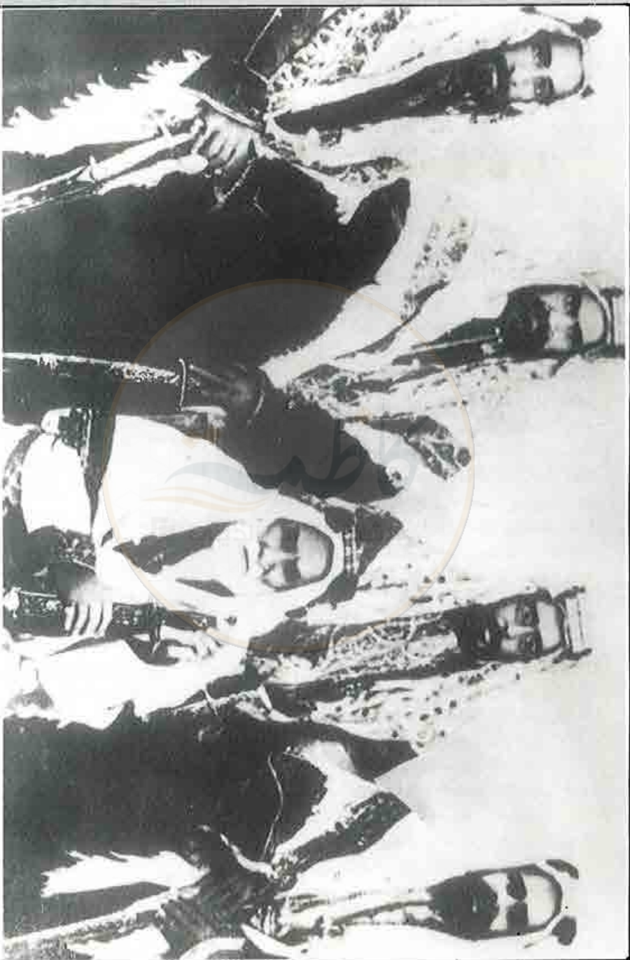
الشيخ عيسى بن علي بن خليفة آل خليفة في الوسط وعلى يمينه الشيخ حمد بن عيسى بن علي ثم الشيخ عبد الله بن عيسى بن علي وعلى يساره الشيخ محمد بن عيسى بن علي ثم الشيخ سلمان بن حمد بن عيسى بن علي