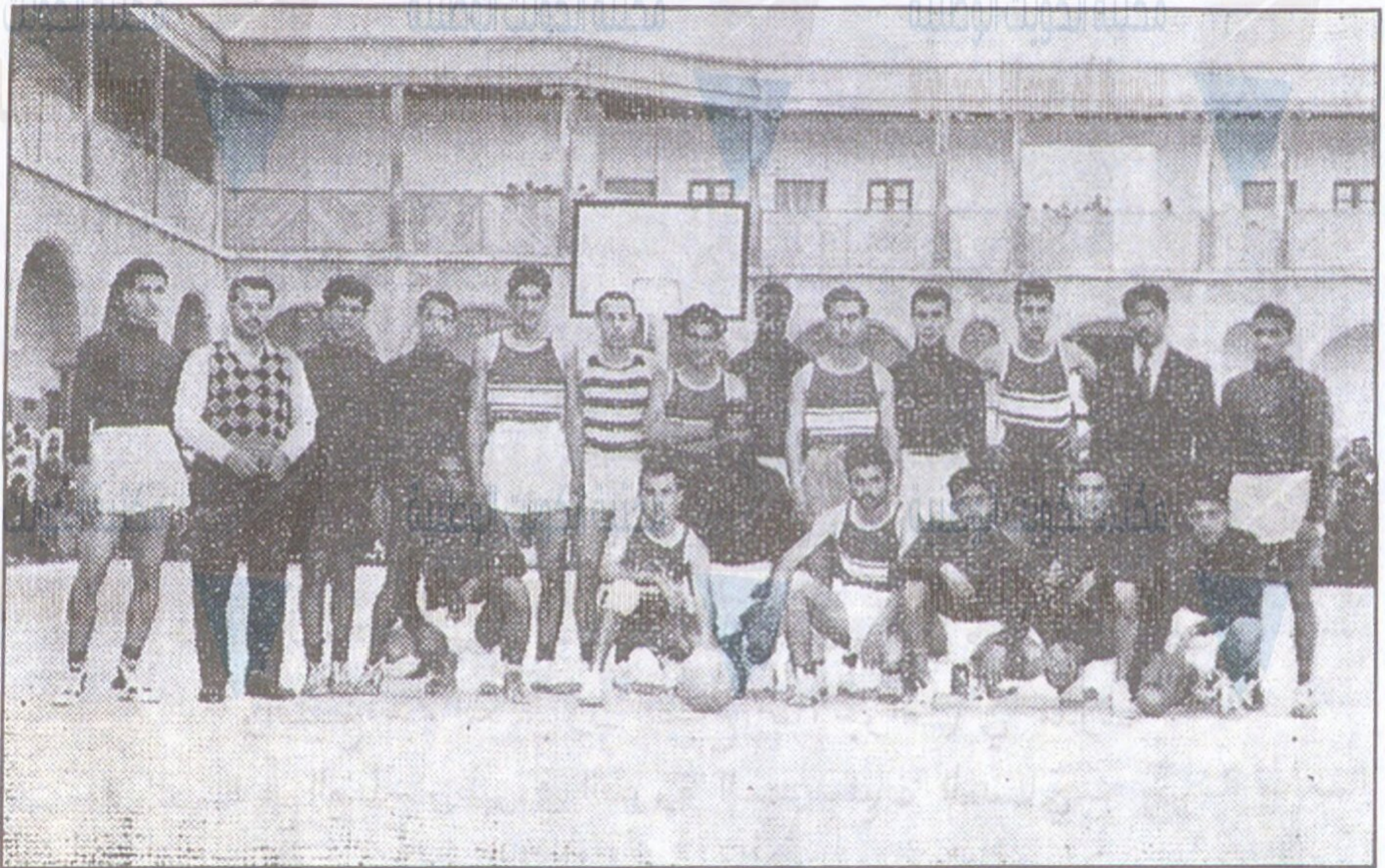
الفريق الرياضي لبعثة كلية الهندسة الصناعية ببغداد اثناء مباراته في كرة السلة مع فريق المعارف في الكويت على ملعب مدرسة الصباح