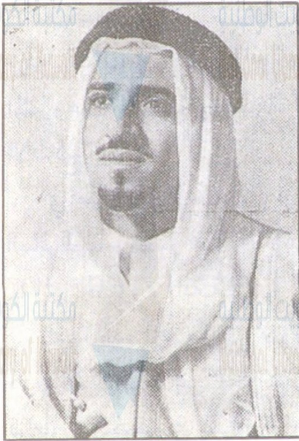
«حضرة صاحب السعادة الشيخ صباح الاحمد الجابر الصباح رئيس الشرف لنادي المعلمين»

العقل ، فقد تستنفد الجهود الكثيرة دون ثمرة ، لأنها إما ان تكون قد جاءت قبل أوانها ، أو تخلفت بعد زمانها وهي على كلا الحالين تفقد العناصر التي تؤهلها للبقاء والدوام ، لأن نجاح كل حركة اصلاحية مقرون بقدرتها على الادراك الصحيح لظروف البيئة التي نشأت فيها . ولهذا فستلتزم هذه المجلة خطة العمل الجدي في عرض المشكلات وحلها والتنبيه الى مواطن الخطأ والزلل على هدى العقل وصوت الضمير .