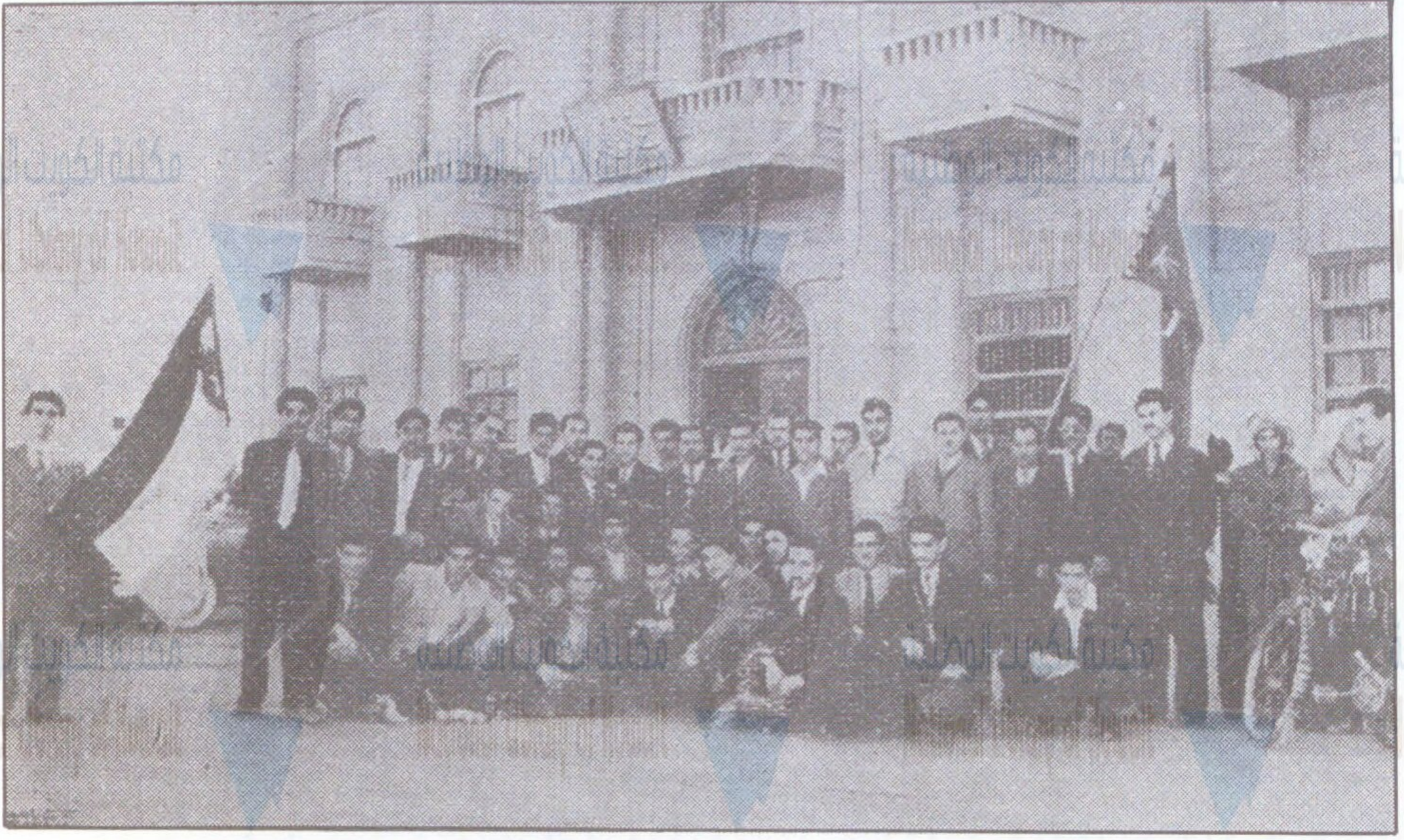
بعثة كلية الهندسة الصناعية في بغداد أمام مبنى ادارة المعارف في الكويت تحت علمي العراق والكويت