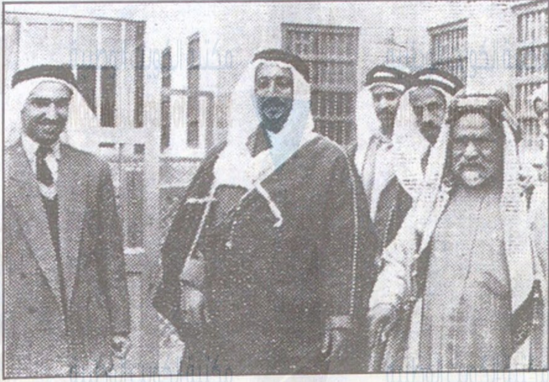
ضيف الكويت الكريم الشيخ خليفة بن سلمان آل خليفة وعن يمينه صاحب السعادة الشيخ عبد الله المبارك الصباح اثناء زيارتهما لمدرسة الصباح