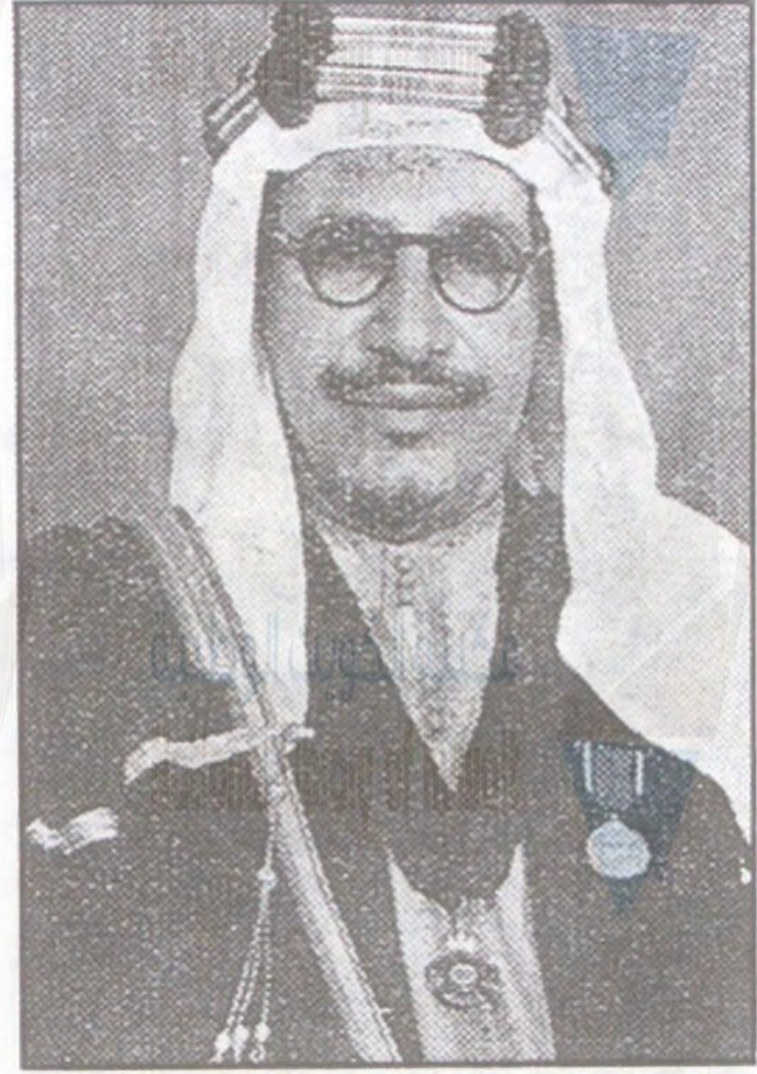
«حضرة صاحب السعادة الشيخ عبد الله الجابر الصباح رئيس معارف الكويت»

إن الكويت - في عهدها الحاضر - تهب بانباءً جميعاً الى توفير الجهود لها ، والعمل على اعزاز شأنها ، فلا سبيل الى التقدم ، إلا اذا أحس كل كويتي انه مسئول عن الكويت ، ثم تطور هذا الاحساس العام الى عمل منهجي مستمر يقوم على تعقل المشكلات ووضع الخطط المناسبة لها ثم تنفيذها على خطوات حسب الظروف والاحوال .