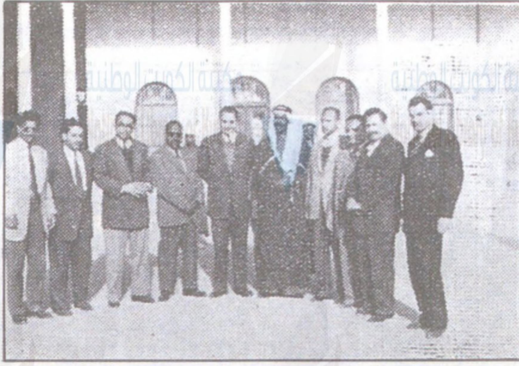
حضرة صاحب السعادة الشيخ فهد السالم الصباح رئيس مجلسي البلدية والصحة اثناء زيارة بعثة المدرسين المصريين في العراق لسعادته في ديوانه العامر