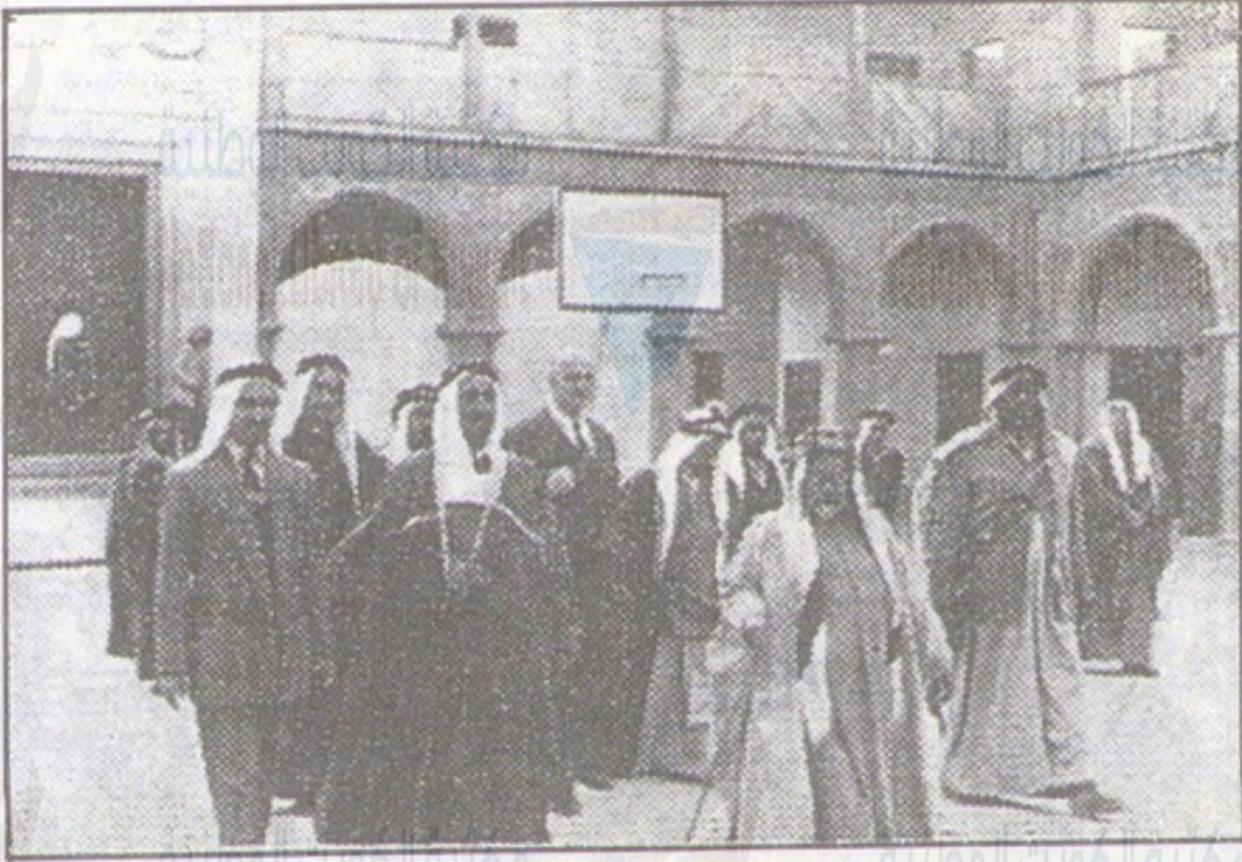
صاحباً السعادة الشيخ خليفة بن سلمان آل خليفة ضيف الكويت والشيخ عبد الله المبارك الصباح اثناء تجوالهما في مدرسة الصباح وظهر في الصورة السيد سليمان العبدساني مدير مالية المعارف والاساتذ درويش المقدادي مدير المعارف ، والاساتذ