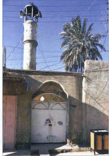
مسجد صاحب الرسالة في البصرة

بين مواني الهند ومواني مدن الخليج العربي (١) ، ولم يتمكن الركاب المتابعون سفرهم إلى البصرة من النزول في ميناء الكويت نظراً لفرض إجراءات الحجر الصحي من قبل الإدارة البريطانية على مواني الخليج ومنها الكويت.