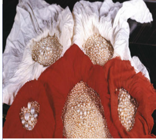
صورة توضح أحجاماً مختلفة من اللؤلؤ

(١) جدول الدانات محلول إلى خمسين دانة، ومنها إلى الألف بإثبات العقود؛ لأن ما بين كل عقدين لا يخفى على التلميذ لبساطته، وسيصدر بالطبع الأخير محلولاً إن شاء الله تعالى بكيفية أسهل من هذا.