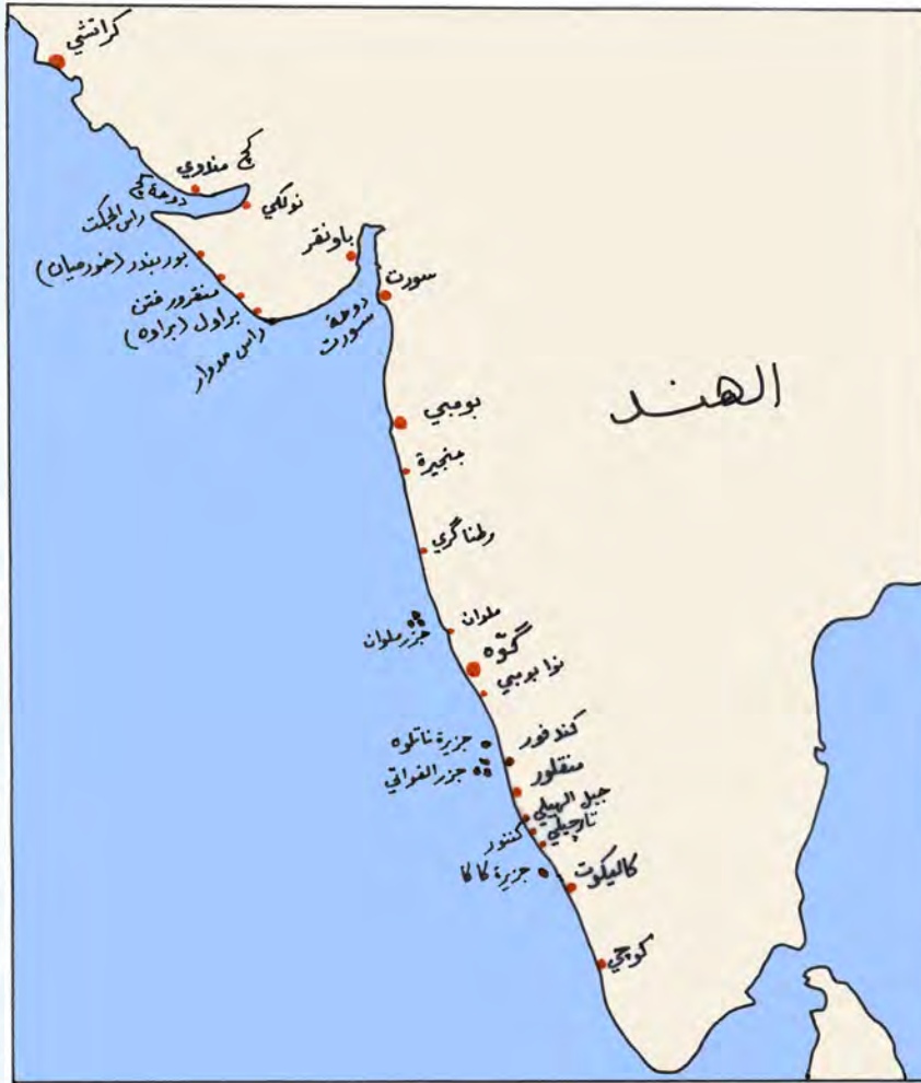
موانئ الهند المذكورة في الروزنامة

الأوراق من الجمرك، وبدأوا في الإبحار جنوبا بعد شراء ذبيحة وسعف من الزيادة، وكان الهواء يهب بشدة من جهة الشمال. ومن السفن التي رأوها في طريقهم بوم بوقريمز وبوم يوسف الجاسم متجهين نحو البصرة (داشين). وفي يوم ١٧ من يناير تم الترخيص من الفاو وبدأت الرحلة باتجاه كراتشي، وكان معهم بوم عيسى بن معتوق وبوم حبيب بوشهري وبوم فخره (نوخاه عجمي)، وفي يوم الأحد الموافق ١٩ من يناير كانوا أمام بوشهر، وصادفهم عيد الأضحى وهم أمام جبل