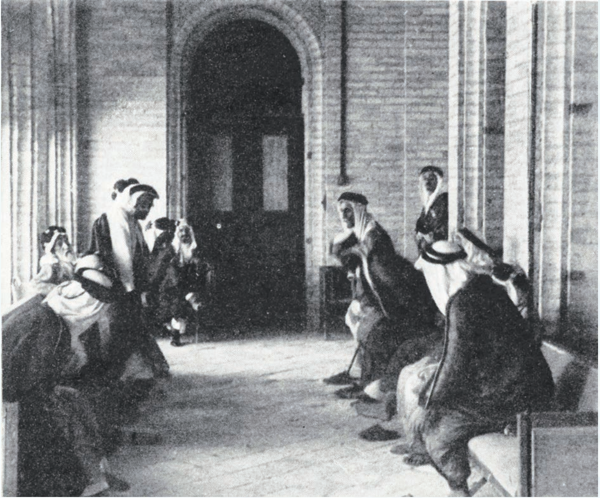
مجلس الشيخ أحمد الجابر الصباح الذي يبدو في صدر الصورة (نوفمبر ١٩٣٨م)