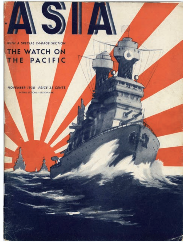
غلاف مجلة آسيا والصفحة المتعلقة بالكويت (نوفمبر ١٩٣٨ م)