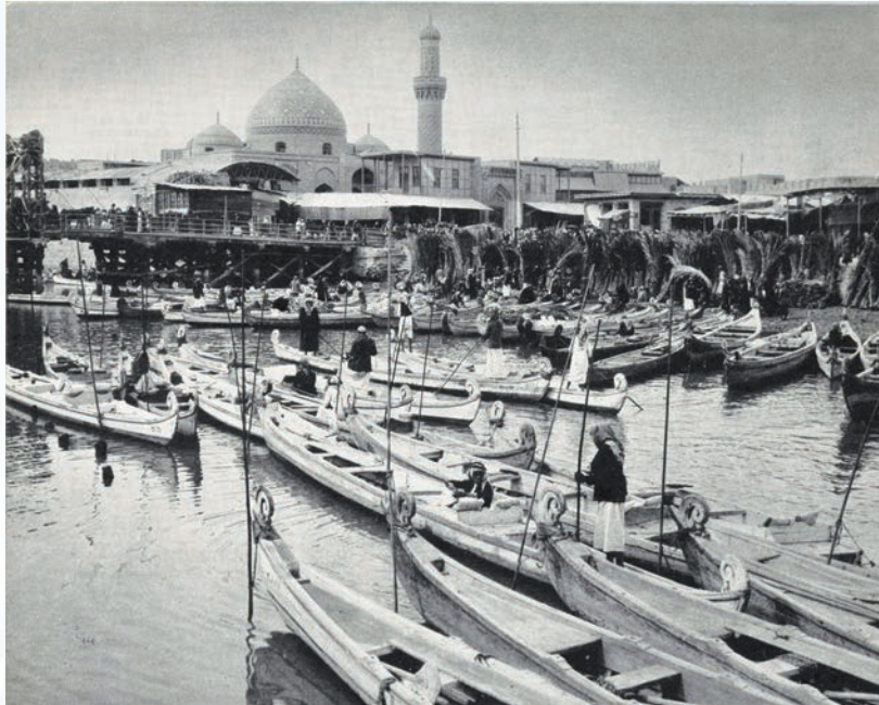
مدينة العشار في جنوب العراق (يناير ١٩٣٨م)

في هذا العدد هو الصفحة ٦٦٨ التي جاء فيها ثلاث صور عن الكويت تحت عنوان «في بلاط الكويت»، وقد علق الكاتب على كل صورة من الصور المذكورة، وتمثل الصورة الأولى (أعلى الصفحة) قاعة الاستقبال الخاصة بسمو الشيخ أحمد الجابر الصباح حاكم الكويت آنذاك وقد جلس على أحد المقاعد السيد عزت جعفر سكرتير الأمير، وجاء شرح الصورة على النحو التالي: «صاحب السمو الشيخ أحمد الجابر الصباح حاكم الكويت -التي تقع على الخليج العربي في الركن الشمالي الشرقي من الجزيرة العربية- قد تولى الحكم عام ١٩٢١م خلفا لعمه، ويتكون مسكنه من جناح وعدة غرف ذات طابع أوروبي، وأحد طهاته قد تدرب على الطبخ الأوربي، ويلاحظ فوق المدفأة صورة للملك جورج الخامس الذي