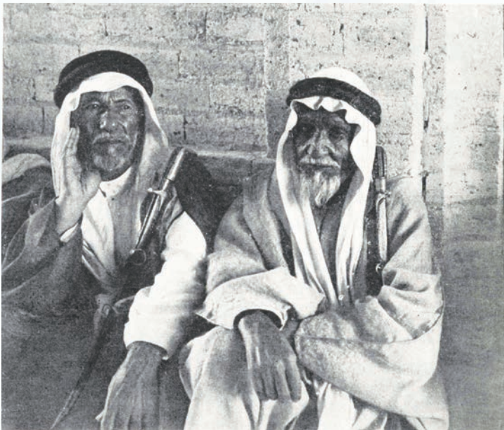
شخصان من بين الجالسين عند الأمير (نوفمبر ١٩٣٨م)