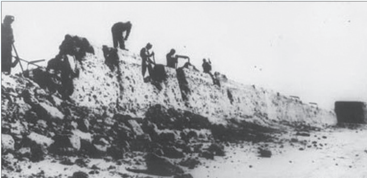
هدم السور عام ١٩٥٧م