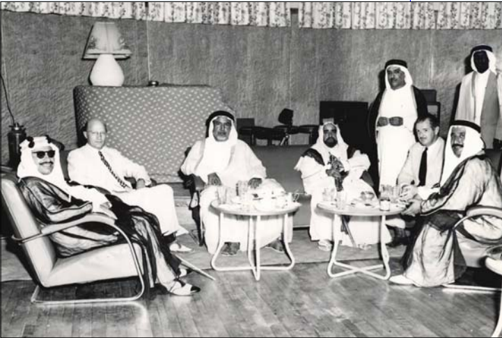
جلسة تجمع سمو الشيخ عبدالله السالم وسمو الشيخ سلمان آل خليفة والشيخ عبدالله المبارك والشيخ عبدالله الجابر

* عندما زار عظمته دائرة الأشغال العامة بالكويت أبدى