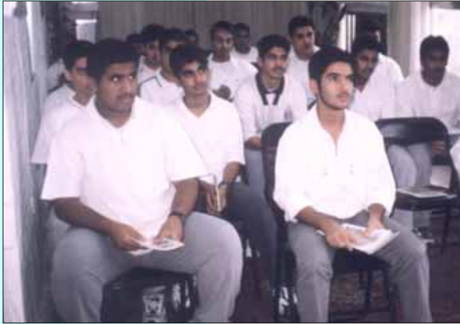
طالبة إحدى المدارس الثانوية يستمعون إلى محاضرة عن الكويت في المركز

ونظامها السياسي في الدفاع عن الوطن وحفظه جيلاً بعد جيل . وتستغرق كل زيارة نحو ساعتين من الحديث والحوار الذي يديره أحد