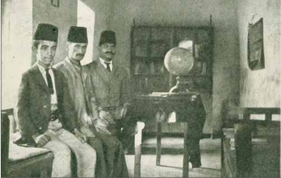
محل عربي لبيع الكتب : إن وجود محل لبيع الكتب في الكويت لدليل على أن البلدة بها مجموعة من المفكرين الجادين