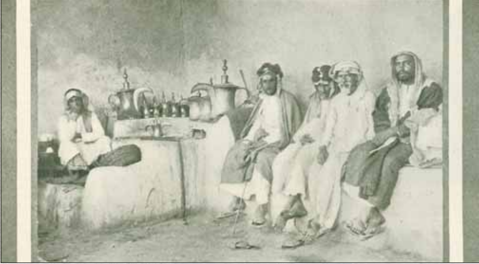
في أحد المقاهي : إذا زرت أحد مقاهي الكويت وطالعت الجالسين فيها فسوف تكتشف أن الكويت هي أكثر البلاد العربية تمثيلاً للطابع العام للسكان في الخليج وشبه الجزيرة العربية