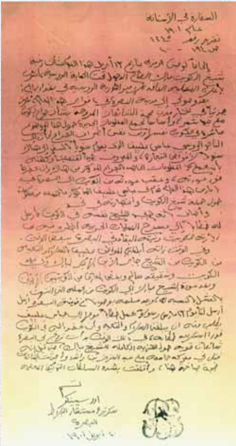
الرسالة السادسة «مُزيّفة»

ومركز البحوث والدراسات الكويتية إذ يكشف عن هذه الظاهرة ويقدم الدلائل والمعايير التي تؤكد مخالفتها للأصل المنقولة عنه يأمل أن