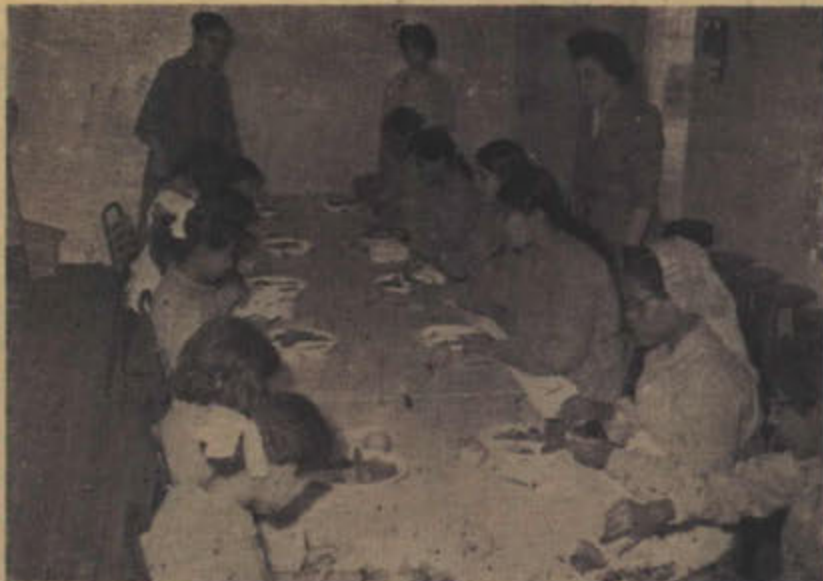
طالبات معهد النور المكفوفات يتناولن طعام الافطار

وقد افتتح في المعهد قسم داخلي للطلبة الذين يقطنون في القرى ، واعددهم ١٢ طالبا ، كما تزعم الادارة اقامة مبنى خاص للقسم الداخل يتسع لجميع الطلبة .