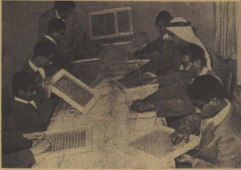
الطلبة المكفوفون يقومون بتدريبهم على العمل

الأعزاء الذين حرموا نعمة البصر من أبناء الكويت الشقيقين لم يحرموا الأمل الذين عاشوا حياة الظلام ، خرجوا إلى نور الحياة الذين كانوا يستجدون حتى اليد التي ترشدهم إلى الطريق لأن يعرفوا الأشراف العزة وكرامة العمل