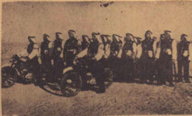
طابور من افراد قوة المرور امام دراجاتهم البخارية في طريقهم الى دورياتهم .