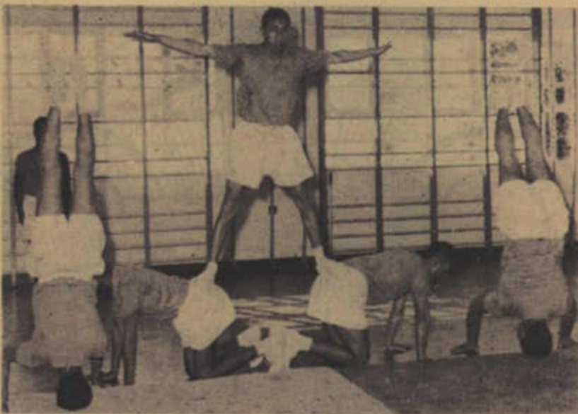
تمرينات رياضية يستقبل بها طلبة معهد النور يومهم الجديد

وقد افتتح معهد النور للمكفوفين والمكفوفات في العام الدراسي ١٩٥٥ ، وبدأت الدراسة فيه في مبنى مؤقت استؤجر له ، وكان عدد طلبته في ذلك الوقت لا يتجاوز ٣٦ طالبا . وفي عام ١٩٥٦ - ١٩٥٧ كان عدد طلابه ٣٩ طالبا ، وصلوا في عام ١٩٥٧ - ١٩٥٨ إلى ٥٠ طالبا ثم زادوا في العام الماضي إلى ٥٦ طالبا .