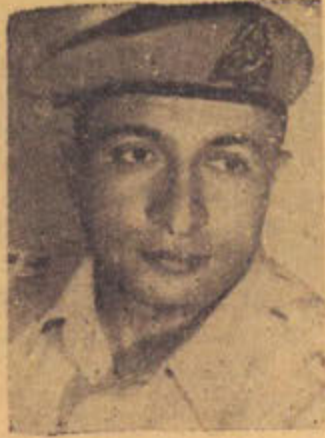
الرئيس «اليوزباشي» مصطفى البطوطي خبير المرور

مواقف للسيارات وفتح الشوارع الجديدة ، ولا تزال هذه اللجنة تباشر نشاطها باستمرار . أما قسم العلاقات العامة بهذه الإدارة فيقوم بتوزيع النشرات التي يرى القاري . صورا لبعضها مع هذا المقال . ويقوم أيضا بعمل الاحصائيات اللازمة ويجري الآن توسيعه لكي يمكن له أن يقوم بحمل أعباء أكثر بعد أن تبين نجاحه فيما يقوم به من خدمات .