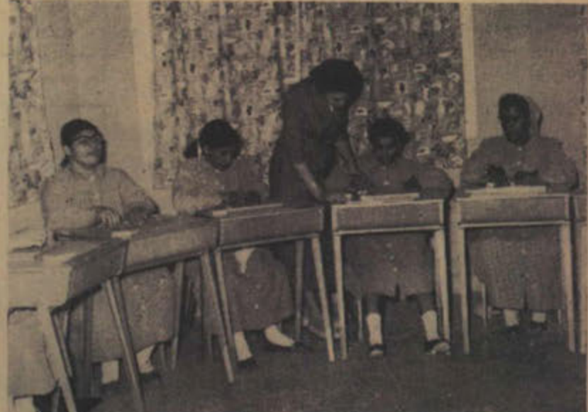
التدريب على القراءة بطريقة بريل