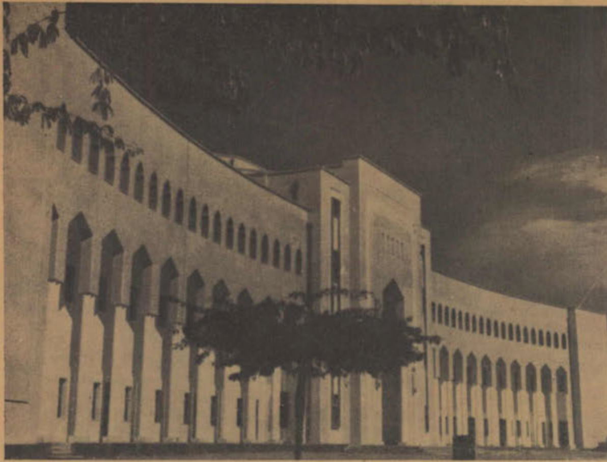
واجهة مبنى ثانوية الشويخ