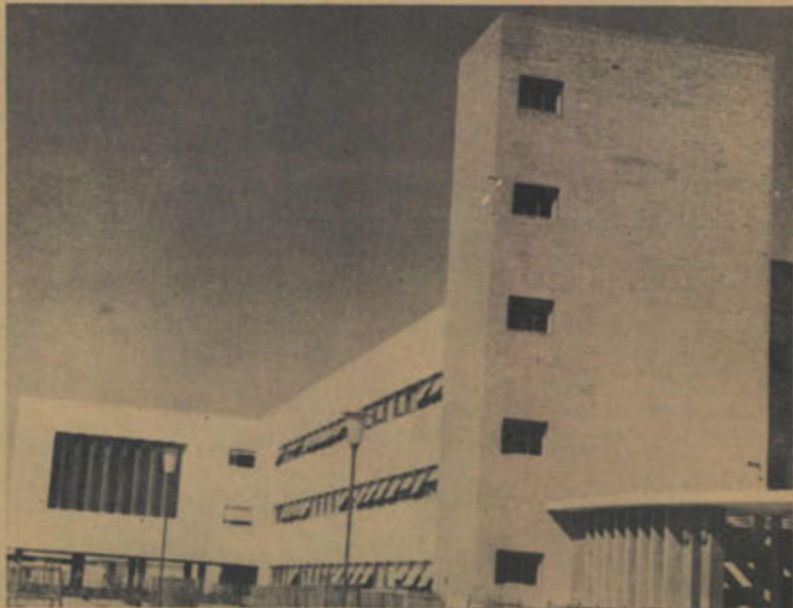
المدرسة الثانوية للبنات

وقد حرصت المدرسة الثانوية للبنين على التوسع في اعطاء الطلاب قسطا وافرا من المسئولية ليتعودوا الحسك الذاتي وتحمل المسئولية من الصغر حتى تتكون فيهم الرجولة الصادقة .. ومن الوسائل