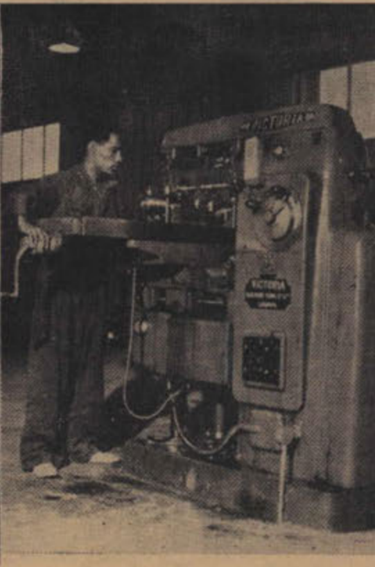
طالب يعمل على ماكينة الفريزة الافقية