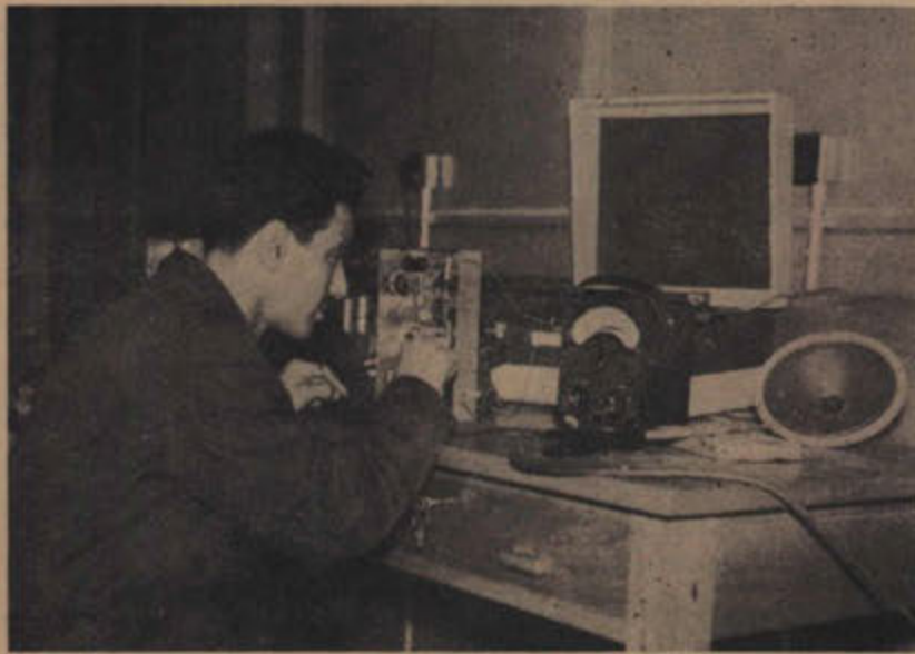
احد طلاب الكلية الصناعية في تدريب عمل على احدى الآلات

ومع ذلك ، فان دائرة المعارف تنوي استكمال مرافق الكلية المقررة بانشاء المباني التالية :