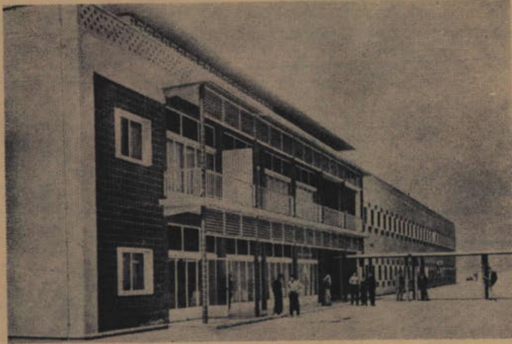
أحد مباني القسم الداخلي