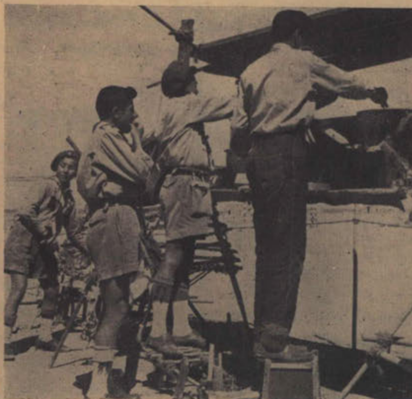
عملية الطبخ في المعسكر الكشفي