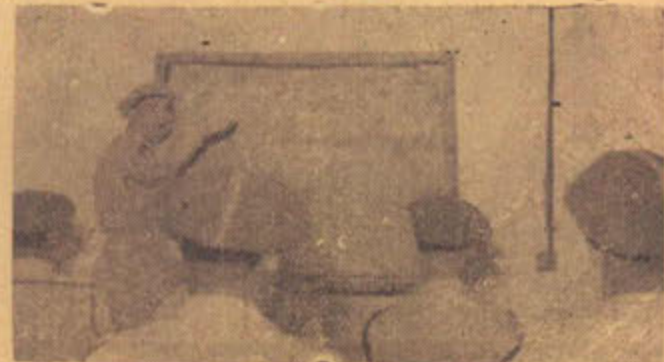
السيد المقدم « البكباشي » متولى رئيس مدرسة الشرطة يلقي درساً على طلبة المدرسة من رجال الشرطة .