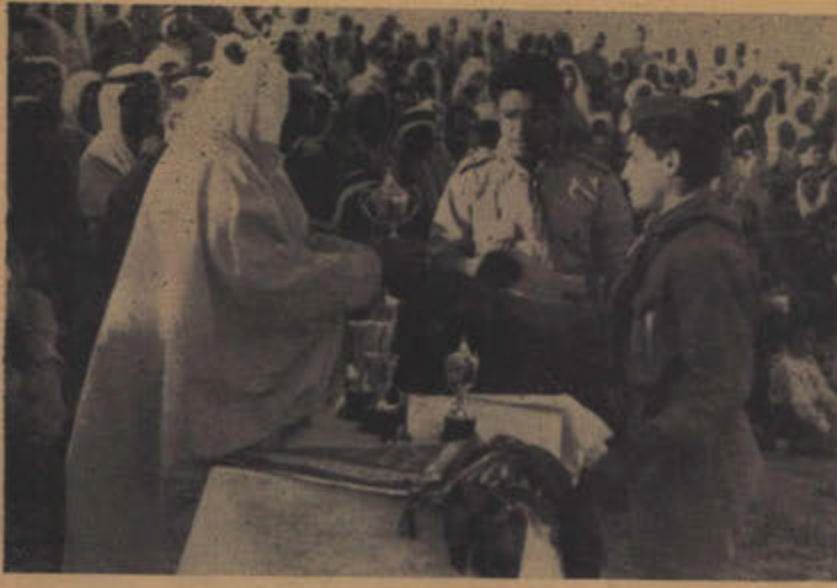
سعادة الشيخ الجابر الصباح يوزع الكؤوس على الفائزين