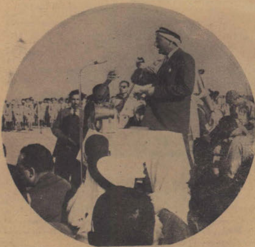
الاساتذ عبد العزيز حسين مدير معارف الكويت يفتتح معسكر الكشافة الثاني عشر

● واشتركت بعدد ٧٧ كشافا في المعسكر الكشفي العربي الثاني الذي اقيم في ابي قير بالاسكندرية في شهر اغسطس عام ١٩٥٦ .