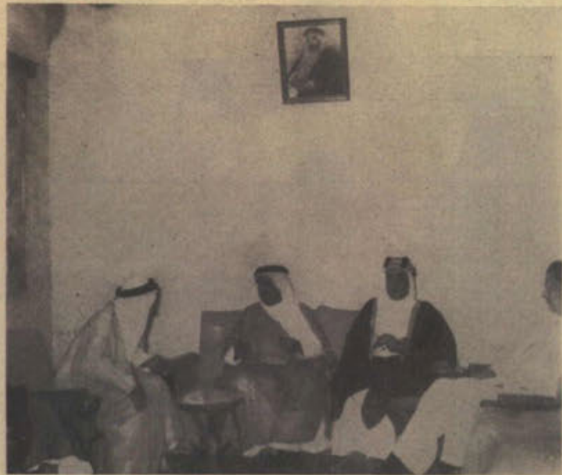
سمو الشيخ عبد الله الاحمد و بجانبه بعض المودعين بمطار الكويت اثناء سفره الى سوريا هذا العام ... نقفاه عطلة الصيف بربوعها

ولقد أخذ التجار بالوسائل الحديثة في الادارة وفي أعمال الاستيراد والتصدير ، مثل المعاملات المصرفية ، فانشأوا الشركات المساهمة الكبيرة