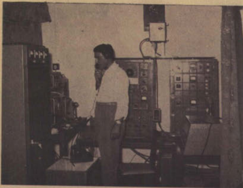
احد اجهزة الاستقبال والارسال الموجودة بقصر سمو الامير عبد الله المبارك الصباح... وبواسطته يمكنه الاتصال باكثر دول العالم ويقوم على ادارته خبراء فنيون مدربون تدريباً كاملاً

ولنشأة هذه الاذاعة قصة طريفة، فقد كانت الاجهزة اللاسلكية التي تقوم بالاذاعة مخصصة اول الامر لوحدة الجيش، وتقوم بالعمل في الدوائر العسكرية ٠٠ ثم ابي سعادة القائد العام للجيش الا أن يفيد الشعب من قوة اللاسلكي ومنافعه، وبالفعل اجريت تجربة لايجاد محطة اذاعية حكومية تذيع على الشعب القرآن الكريم والاحاديث وبعض الاغاني