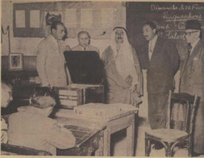
السيد انور السادات مع سمو القائد العام الامير عبد الله المبارك في زيارة لاحدى المدارس المصرية أثناء زيارة سموه مصر