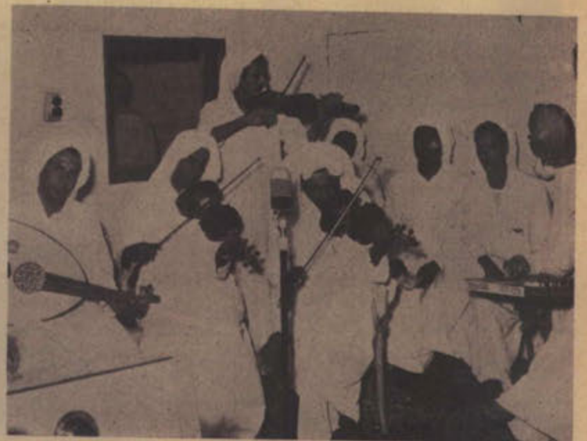
فرقة الموسيقى بالكويت تعزف بعض مختارات للاذاعة الكويتية