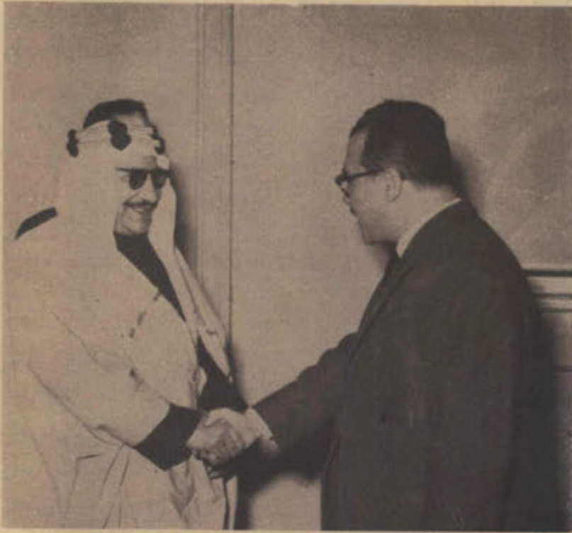
سمو الامير عبد الله الجابر وزير معارف الكويت بصالح الاستاذ محمد طه النمر الوكيل المساعد لوزارة التربية والتعليم المصرية