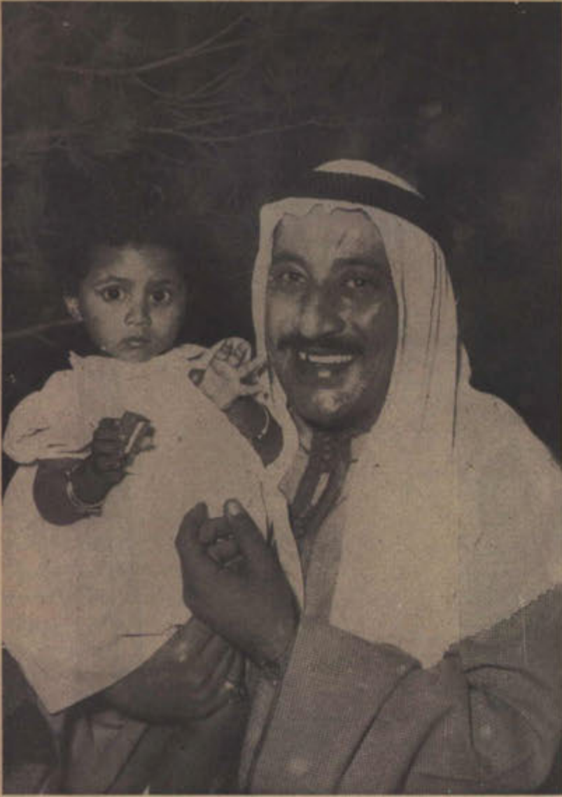
والصورة لسمو الامير وهو يحتضن طفلة صغيرة ويقبلها قبلة ابوية تعلن ما في نفس سموه من تواطف كريمة

كلها صفات اجتمعت في ذلك الامير الرحيم والقائد الحازم سمو الشيخ عبد الله المبارك الصباح نائب الحاكم العام والقائد العام للقوات المسلحة والامن لقد وسع حنان سموه الشامل ، وعدله وانصافه الكبير والصغير ، واتخذ من الشعب كله ابناء له يفدق عليهم حنانه ورعايته .. واعتبره الجميع ابا لهم يدبر امورهم ويسهر عليها في اخلاص وحزم .