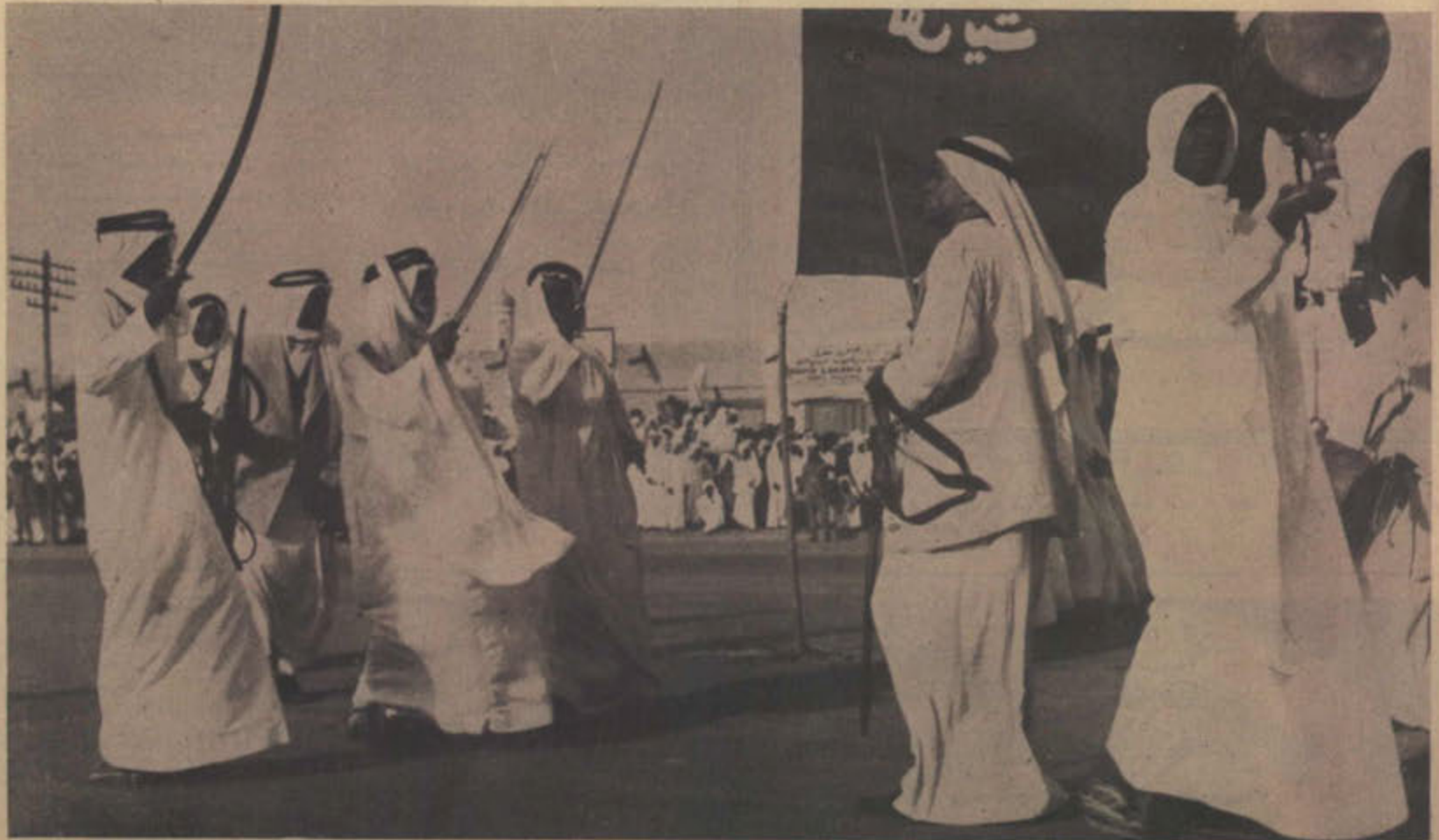
رقصة السيف والحرب يقوم بها سمو الامراء والشعب وذلك فى الامياد والافراح

وترمى سياسة دائرة الشؤون الاجتماعية مستقبلا الى تدعيم هذه الوحدات وتوثيق صلاتها بالمواطنين عن طريق اللجان الاستشارية المشتركة لتنفيذ مشروعات التنمية الاجتماعية فى الحى وجنب الاهالى