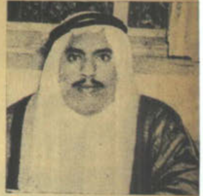
الشيخ صباح الاحمد - مقيم للفقراء

الشيخ صباح الاحمد الصباح وزير الشؤون الاجتماعية بالكويت علم في عام ١٩٥٧ بوجود ٢٠١ رجلا و ١٤٤ امرأة من فقراء الحجاج الباكستانيين في الكويت فأمر السيد الوزير باقامة مخيم لهم فورا وصرف الطعام والادوية ثم صرف لهم تذاكر الى باكستان .. كل ذلك على حساب الوزارة .