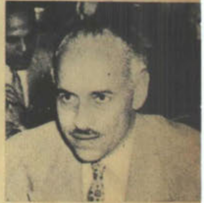
سيد مرعي - مفاجأة لطلبة الزراعة

المهندس سيد مرعي وزير الزراعة والاصلاح الزراعي المركزي فاجأ طلبة السنة الاولى بكلية زراعة عين شمس يوم الثلاثاء الماضي بان زار الكلية والقى عليهم محاضرة عن النهضة الزراعية .. وهذه ثاني مرة يزور فيها الوزير الكلية في خلال شهر والطريف ان ابن الوزير طالب بالسنة الاولى