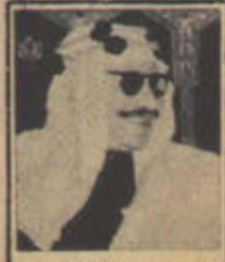
الشيخ عبد الله الصباح مدارس لعرب الهند

الشيخ عبد الله الجابر الصباح وزير المعارف في الكويت امر بافتتاح مدرسة في بومباي بالهند واخرى بكراتشي في باكستان لتعليم ابناء الجاليات العربية الدين الاسلامي والعلوم الاخرى كما انه امر بالمساهمة في مدارس اخرى لنفس الغرض في بعض امارات الخليج العربي .