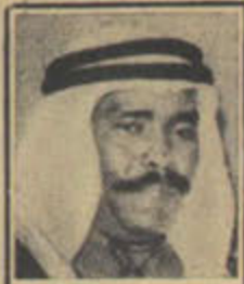
الشيخ فهد الصباح معونة للجزائريين

الشيخ فهد الصباح وزير الامن والشرطة في الكويت تبرع أثناء رحلته الاخيرة الى اوربا واثنا مروره بالمغرب بمبلغ مليار فرنك ( ١٠٠.٠٠٠ جنيه ) للهلال الاحمر المغربي ولعصاة اللاجئين الجزائريين هناك .