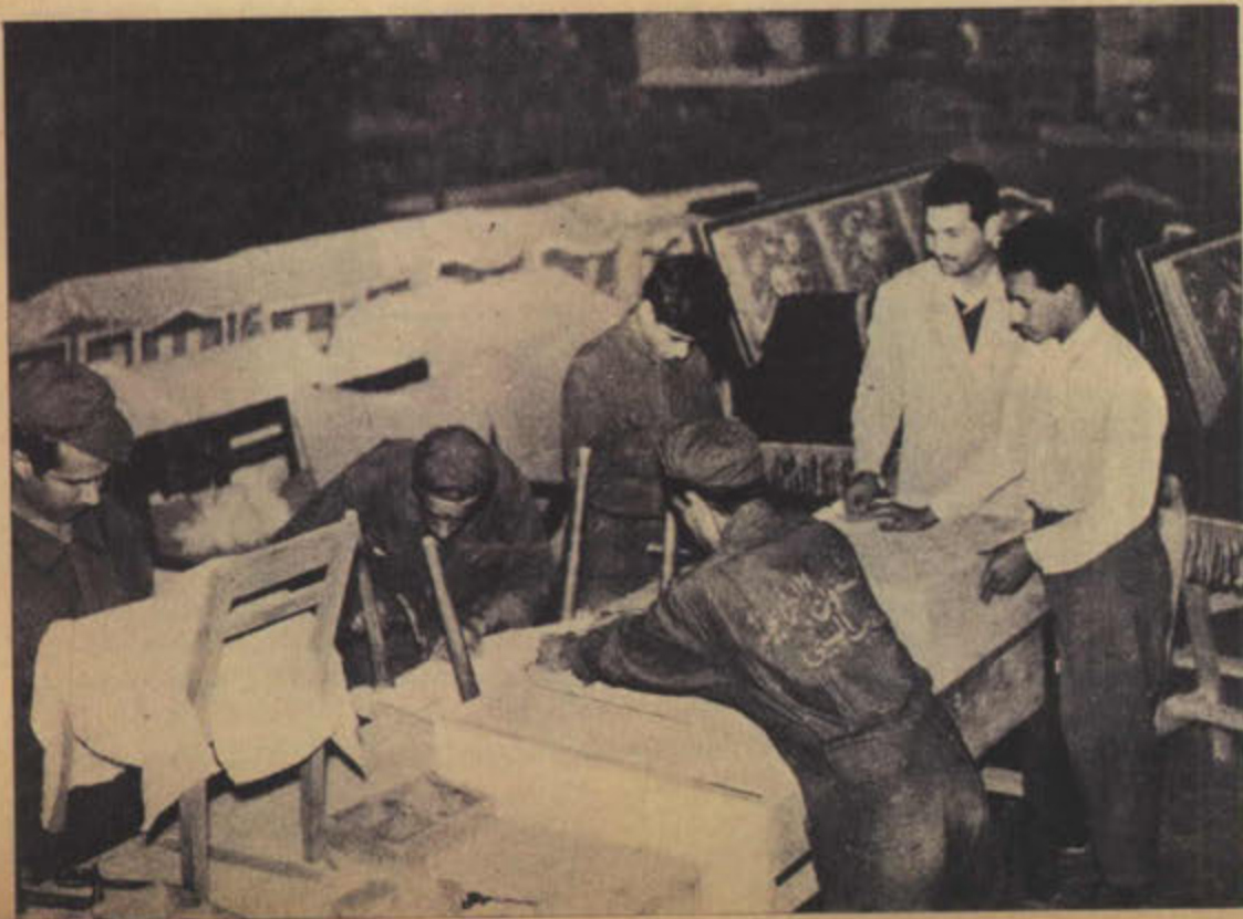
عامل كويتي يتدرب العمال على جميع انواع المهن ويرى عمال يتربون على اممال التنجيد