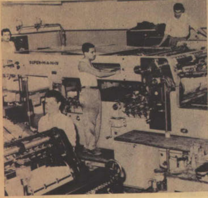
مطبعة الحكومة في الكويت