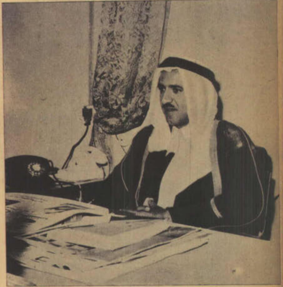
الشيخ صباح الاحمد الصباح رئيس دائرة المطبوعات والشؤون الاجتماعية

اما لماذا أنشئت هذه الدائرة التي تقوم بكل هذه الاعباء الملقاة عليها .. خصوصا والكويت في مرحلة جديدة من