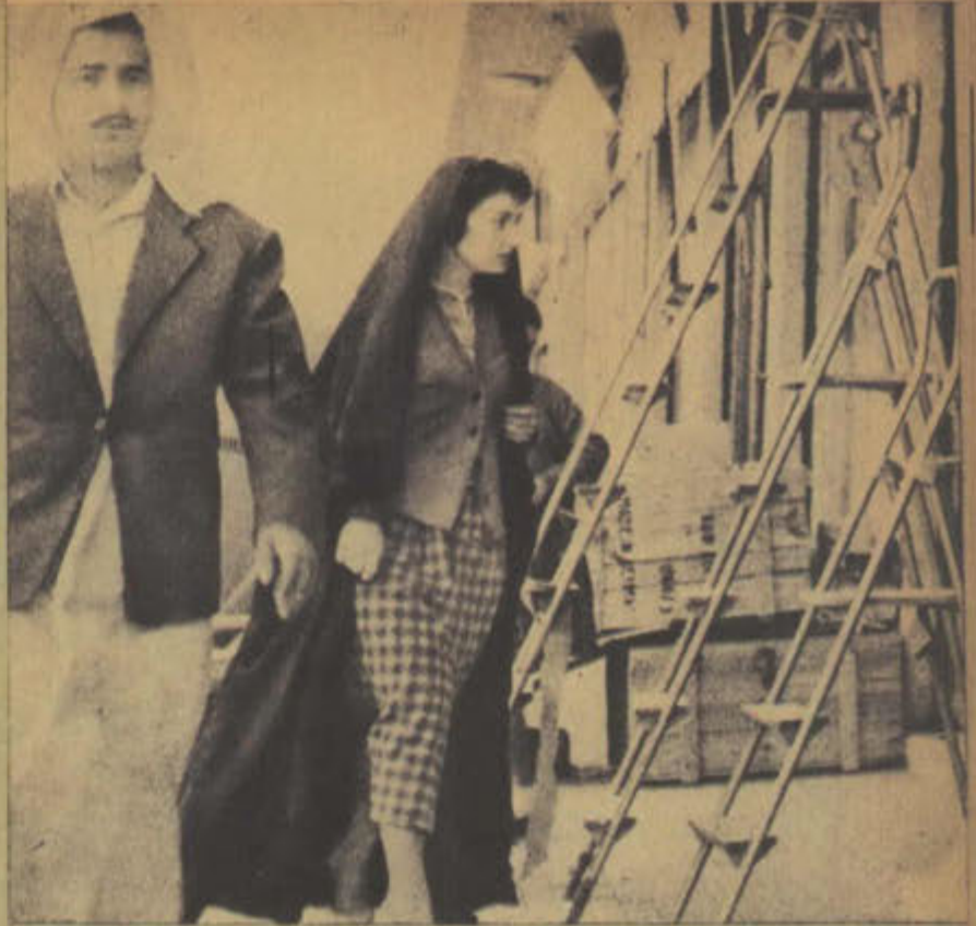
لا بد من العباة في الكويت .. المرأة تطالب بالتحرد من الزي العربي الكامل ، وقد استطاعت ان تكسب نصف الحركة .. انها تستطيع ان ترتدي الكلبس « المودرن » ولكن لا بد من العباة ..