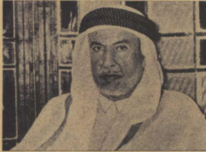
صاحب السمو الأمير الشيخ عبد الله السالم الصباح والفق على الفكرة ودعم البنك ..