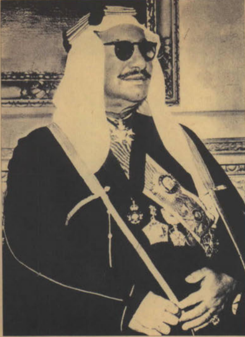
سمو الامير عبد الله الجابر الصباح رئيس دائرة المعارف في الكويت