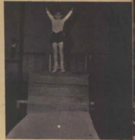
طالب في مدرسة الشامية المتوسطة يتكرب في الجمنزيوم