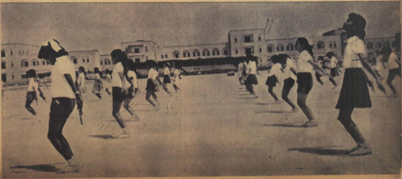
احد وسائل التربية في مدارس الكويت

النهضة العلمية في الكويت اليوم مذهلة لكل الذين يعرفون الكويت من سنوات قريبة .. ففي سنة ١٩٣٦ لم يكن هنالك سوى مدرستان فقط للبنين .. ولا توجد مدارس للبنات و ٦٠٠ طالب و ٢٦ مدرسا .. كانت كلها مدارس ابتدائية .. ثم جاء سمو حاكم الكويت الراحل الشيخ الاحمد الصباح وابدى اهتماما كبيرا بالتعليم .. استعان بمدرسين من مصر .. وزاد عدد المدارس في عهده سنة ١٩٤٧ « الى ١٨ مدرسة بها ٣٠٢٧ طالبا و ٩٣٥ طالبة .