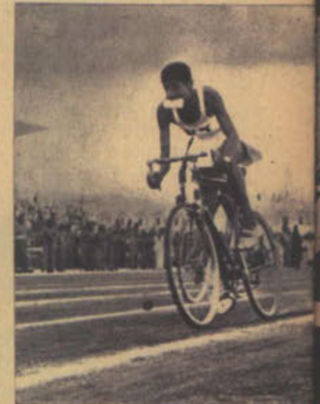
في استاد مدرسة الكويت الثانوية