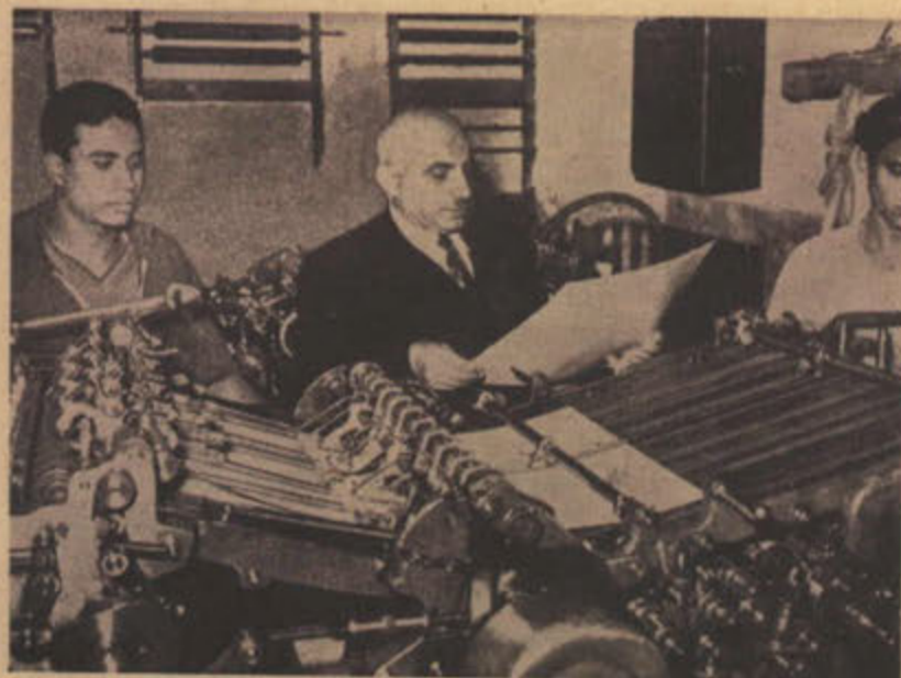
المطبعة الكويتية وقد سار العمل فيها بجهد ونشاط

هذا وقد سرت لنا دائرة المطبوعات مهمتها وعاونتنا اجمل معونة في مراجعة التحقيقات والبيانات التي حصلنا عليها ، واعتمدتها لنا بصورة جعلتنا نشعر بالامتنان والشكر لكل العاملين فيها .