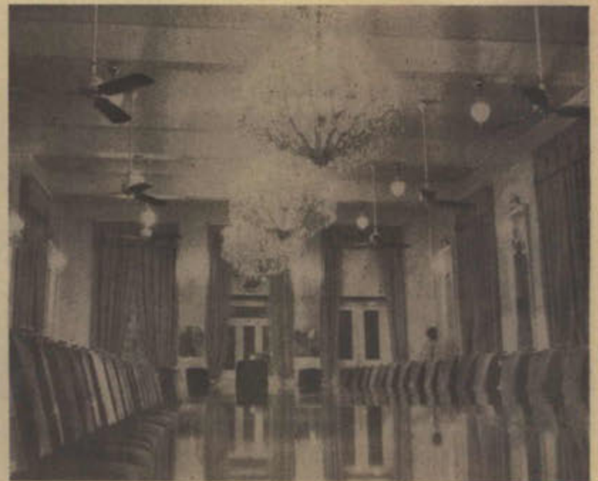
حجرة الطعام بالقصر الأبيض وقد تناثرت فيها الثريات الفاخرة