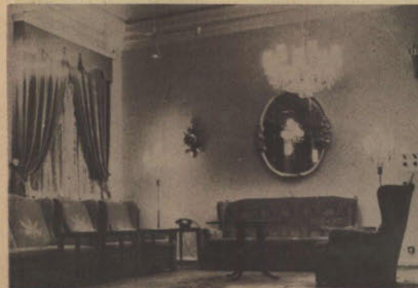
بعض الحجرات البديعة التانيث بالقصر الأبيض