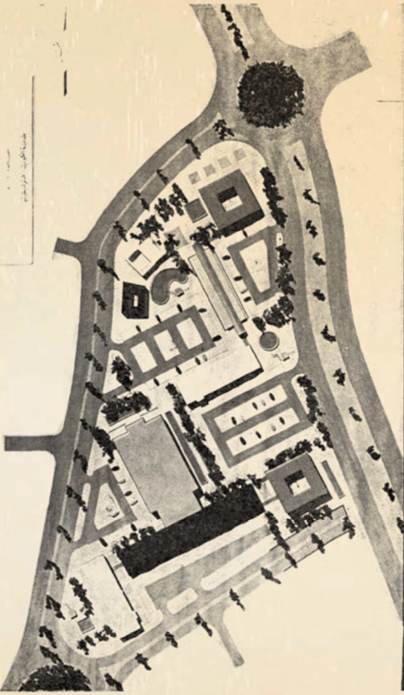
رقم - ٢٥ - مجسم احد الدراسات للنظمة الثالثة(منطقة البنوك) من المنطقة التجارية المركزية وهي قيد التنفيذ حاليا . ( المؤلف )