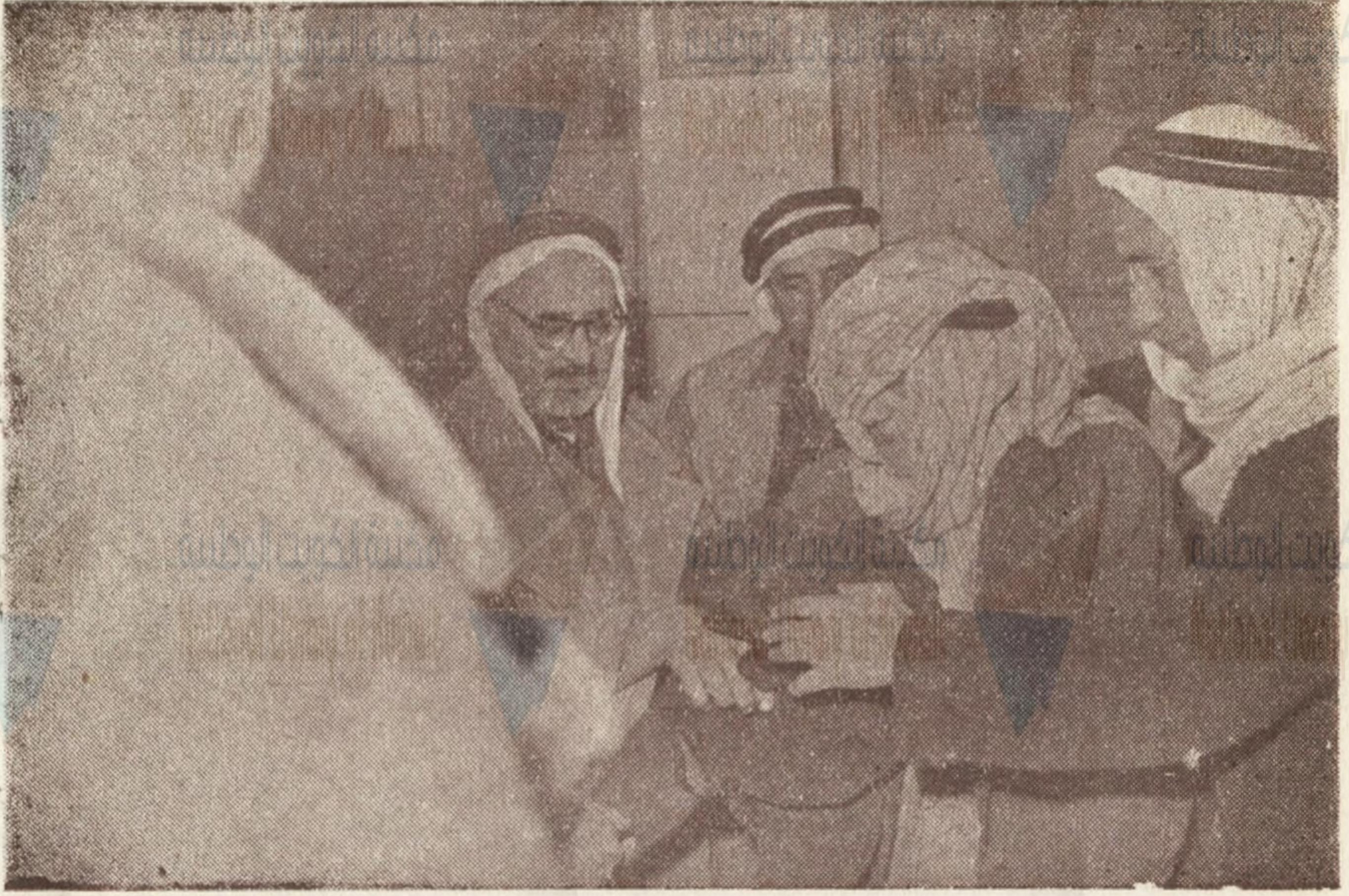
احد اللاجئين وقد هدته المرض وذهب ببصره البؤس يتسلم نصيبه من الملابس