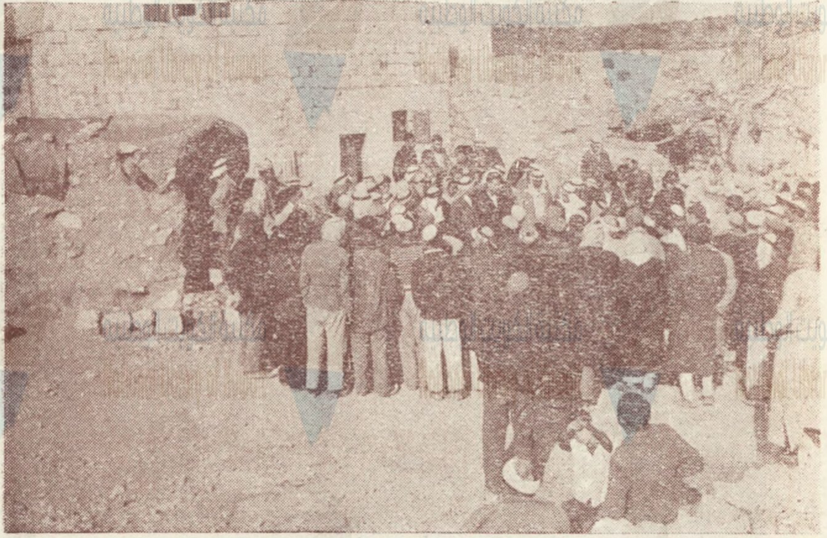
توزيع الهبات من تقود وملابس في بعض احياء القدس