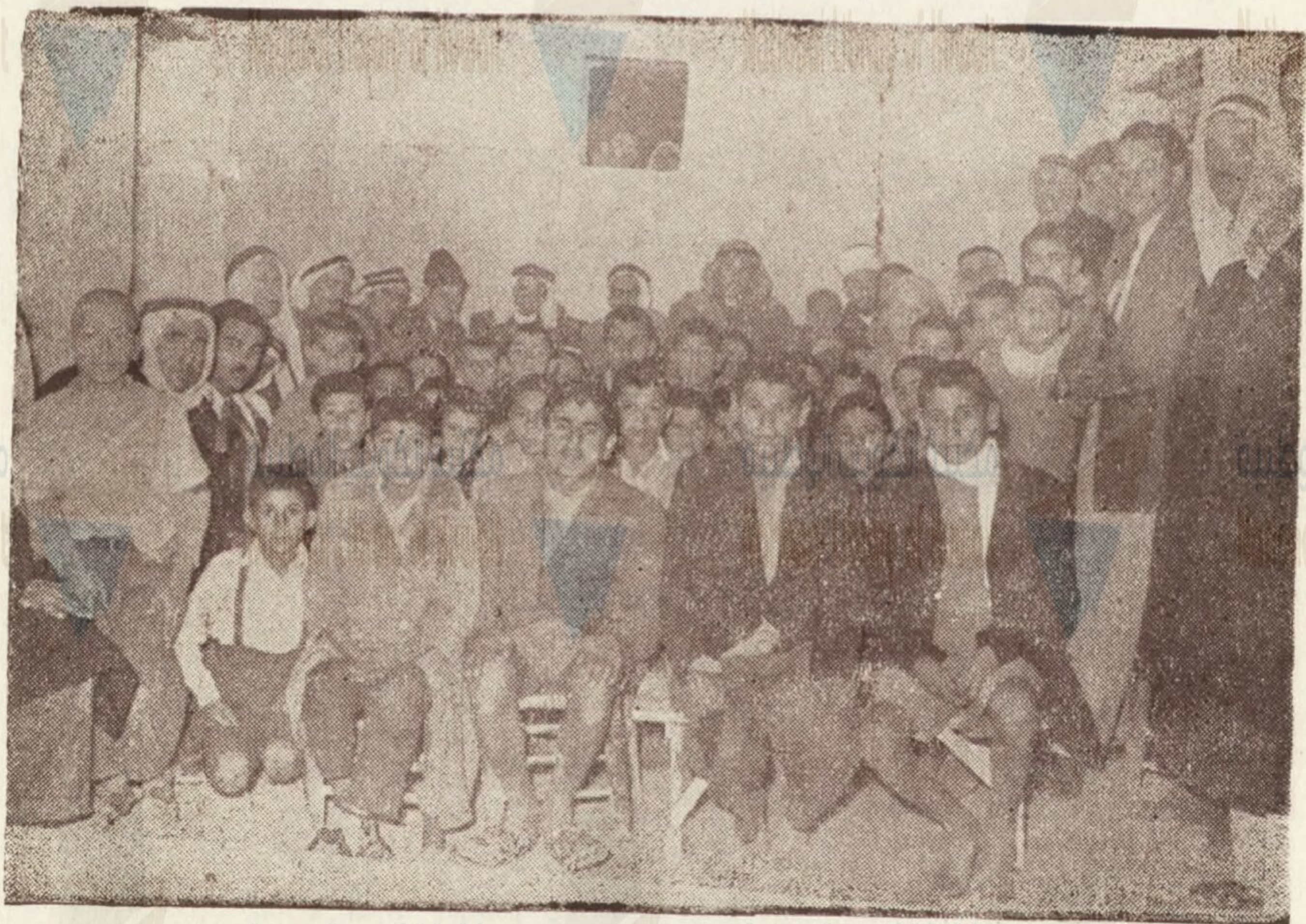
طلبة مدرسة البر بأبناء الشهداء ( بعقبة جبر ) حيث ينام الأيتام أبناء الأبطال الذين ضحوا بدمائهم في سبيل بلادهم ويدرسون بالهجان ، وقد تبرعت لهم البعثة ( ويرى في الصورة اعضاء البعثة ) .