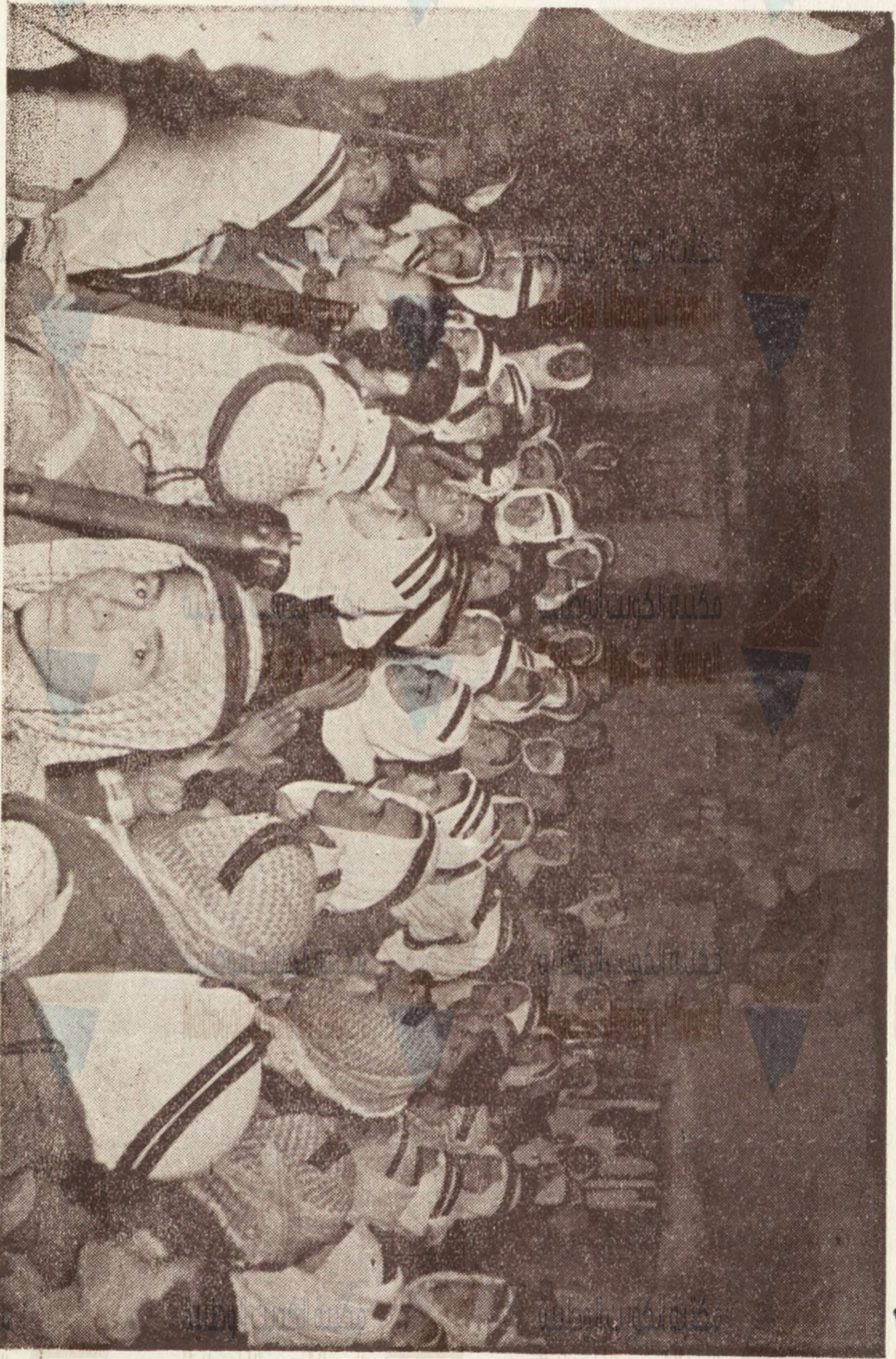
أبطال الحرس الوطني ببلدة إدنة الجاهدة وهي من بلاد الخطوط الأممية بقطاع الخليل وبها ما يربو على الأربعمائة جاهد وقفوا حياتهم وراحتهم في سبيل الدفاع عن دينهم وأعراضهم أمام وحشية اليهود وطفيتهم .