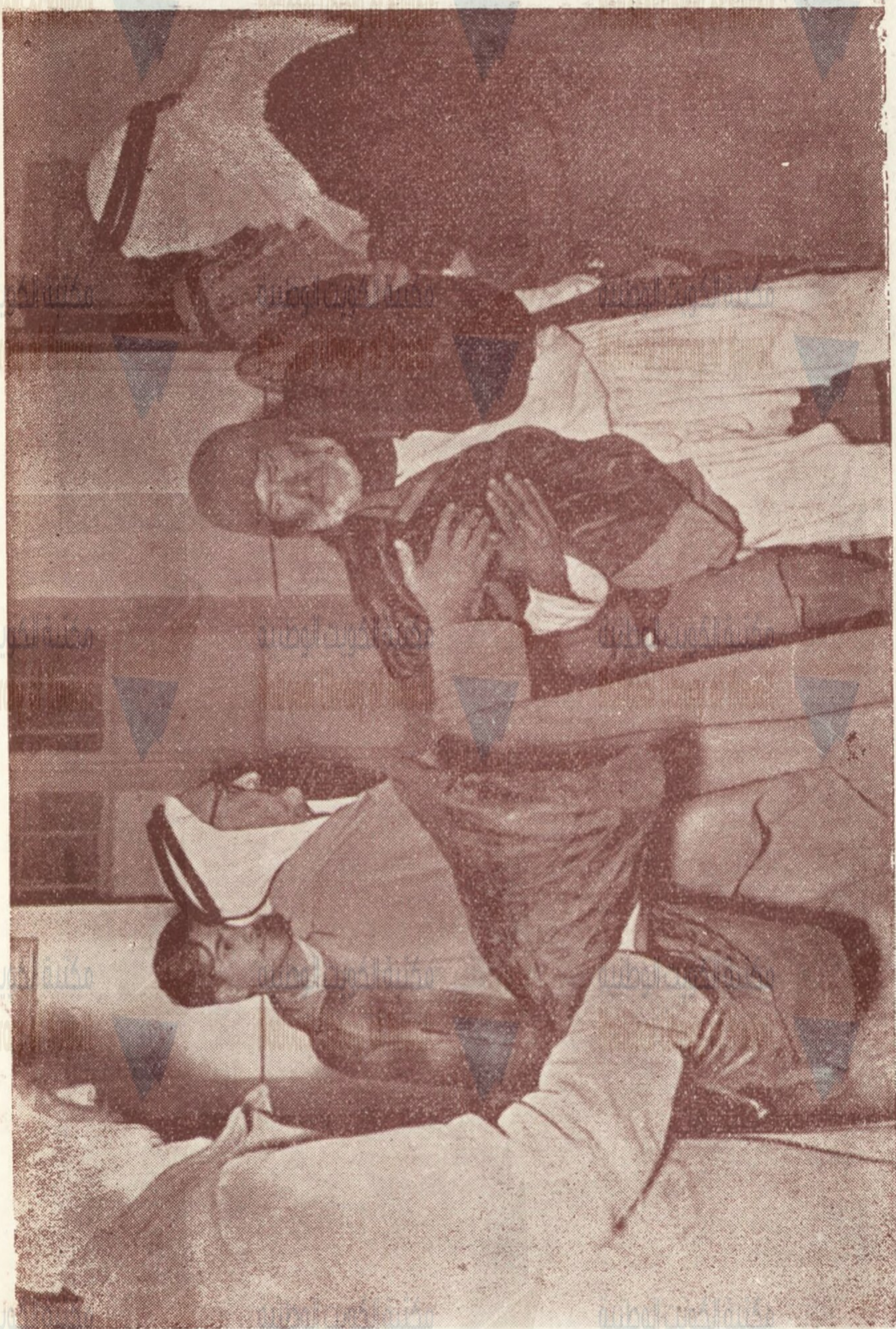
هذا المعجوز الفاني ما ذنبه كي يخرج به اليهود من بلده وبيته ؟ لقد القوه في العراء فريسة للجوع والبرد والشيخوخة . انه فرحاً شاكرآ لهذه الابد الرحيمة التي امتدت اليه بما يدفع به عائلة الجوع والبرد . انه يقول : ( ان ربك لبالمرصاد )