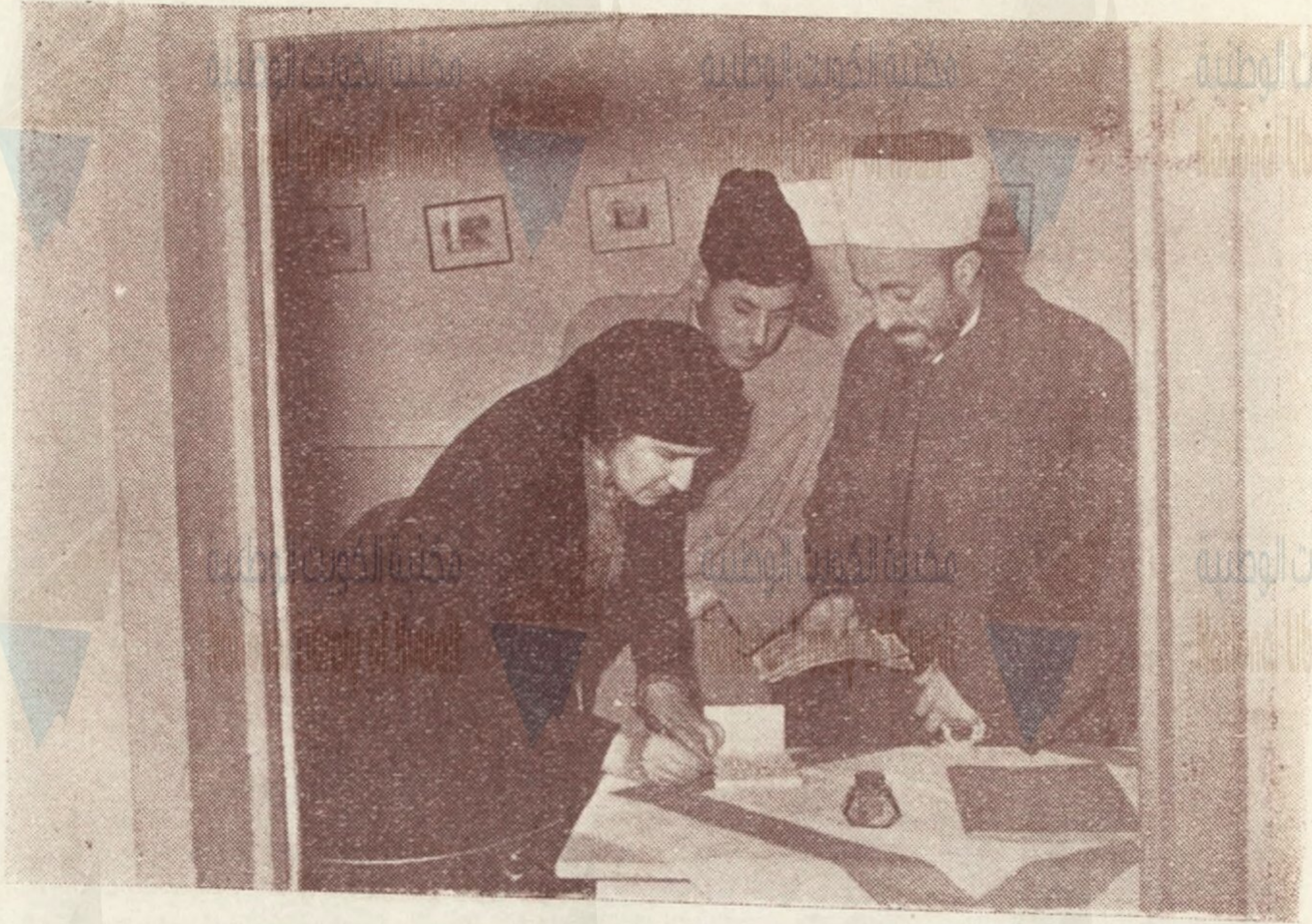
مديرة دار الطفل ( التي تحتضن الأطفال الأيتام ) بنابلس تمضي على

مكتبة الكشوف وتسلم التبرعات مكتبة الكويت الوطنية