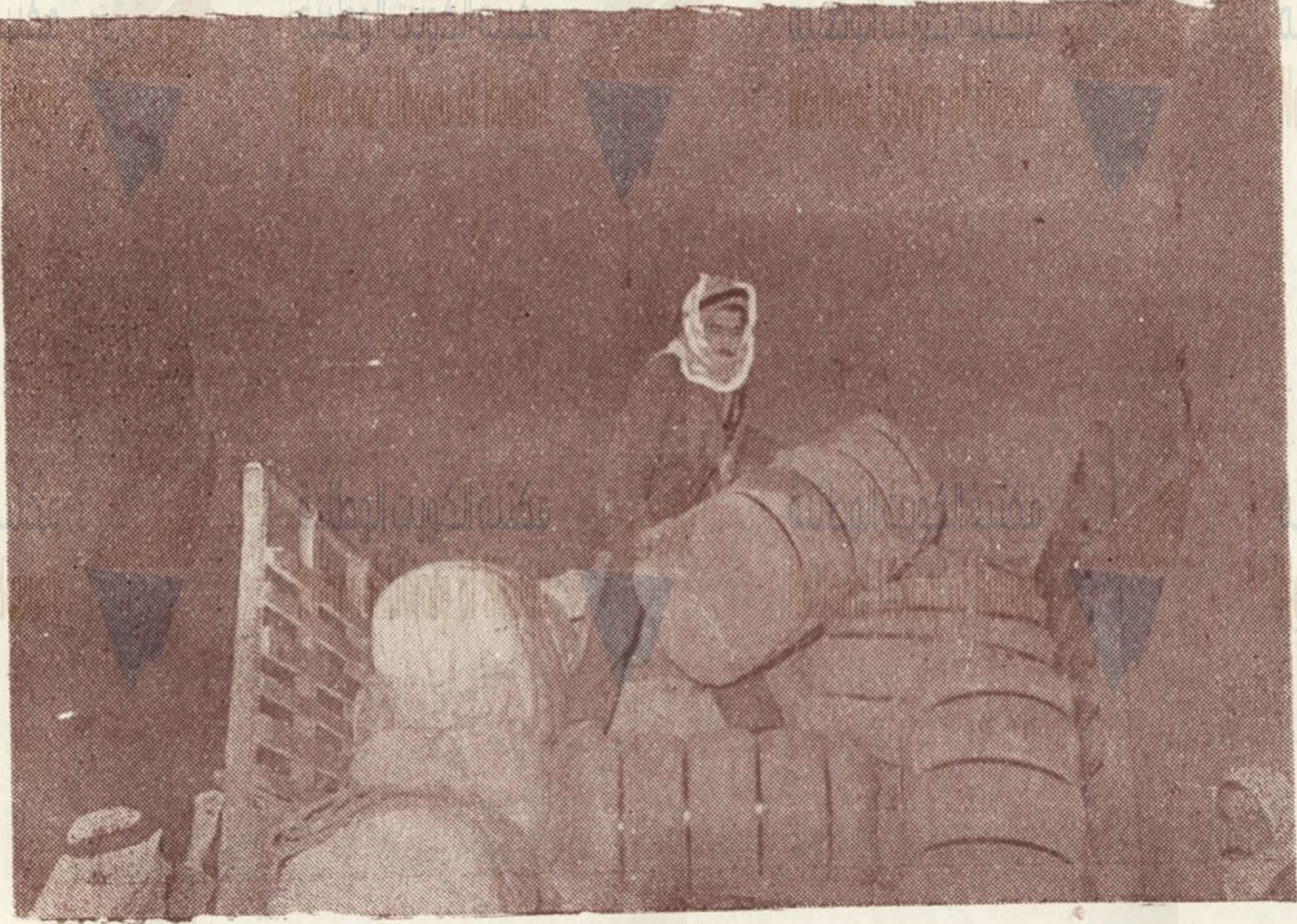
الملابس والأغطية التي حملتها البعثة إلى فلسطين تشحن تمهيداً لارسالها إلى القرى الكويتية الوطنية حيث توزع على اللاجئين