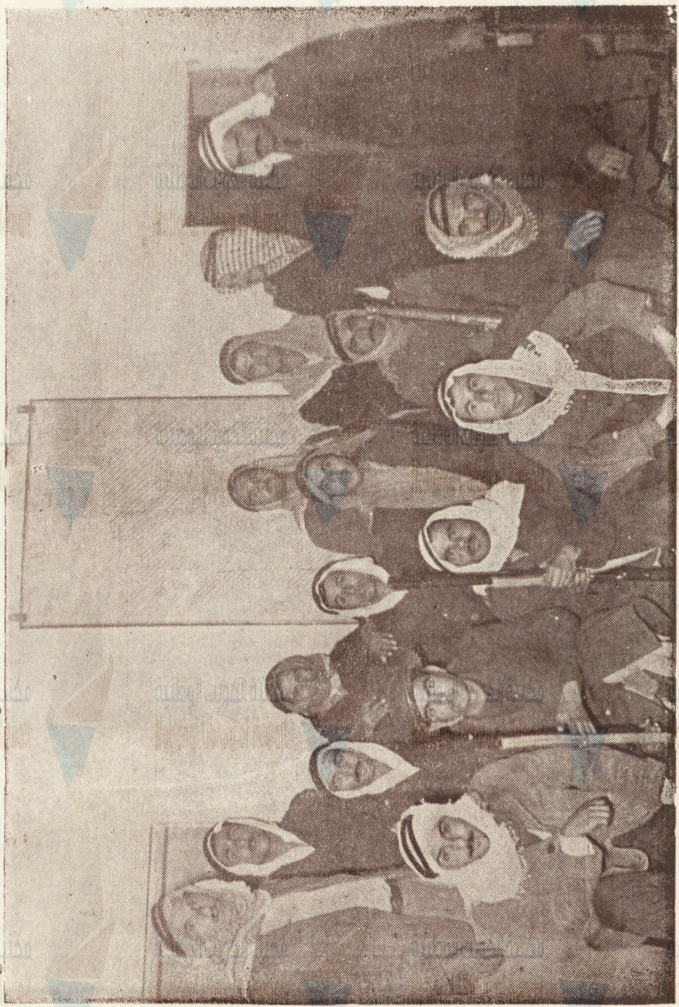
رجال الحرس الوطني ببلدة قفيلية . وكم تعرض هؤلاء الأبطال لهجوم اليهود الفادر فصدوا له وردوا المعتدين على اعقابهم على قلة ذخيرتهم وضعف تسليحتهم