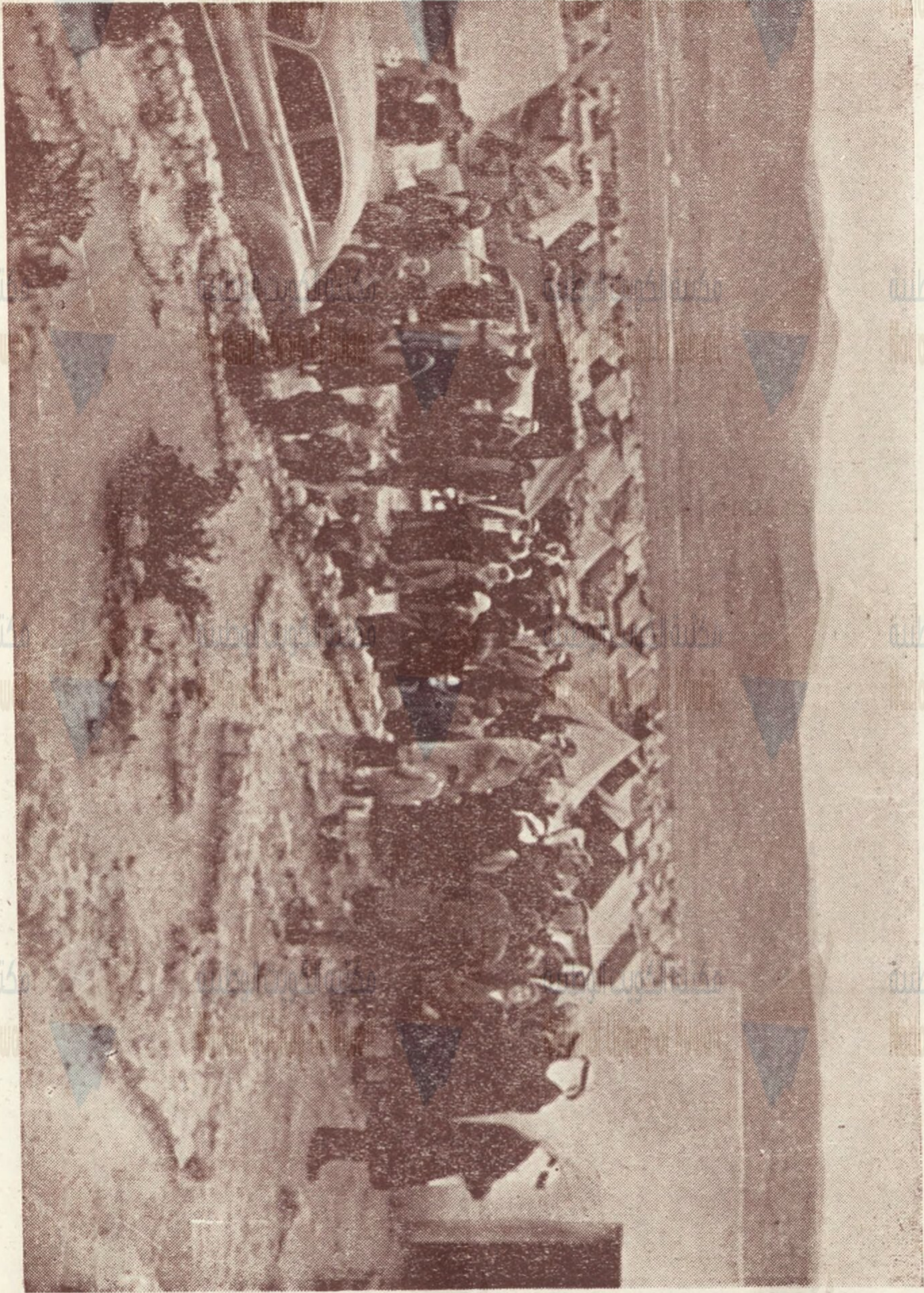
العملة بين مخيمات اللاجئين في مخيم بلاطة بقضاء نابلس

هذه الخيام البالية التي تمزقها العواصف وتعبث بها الرياح هي المأوى لقوم كانوا سادة في بلادهم منعمين في قصورهم أخرجهم منها اليهود اللئام .