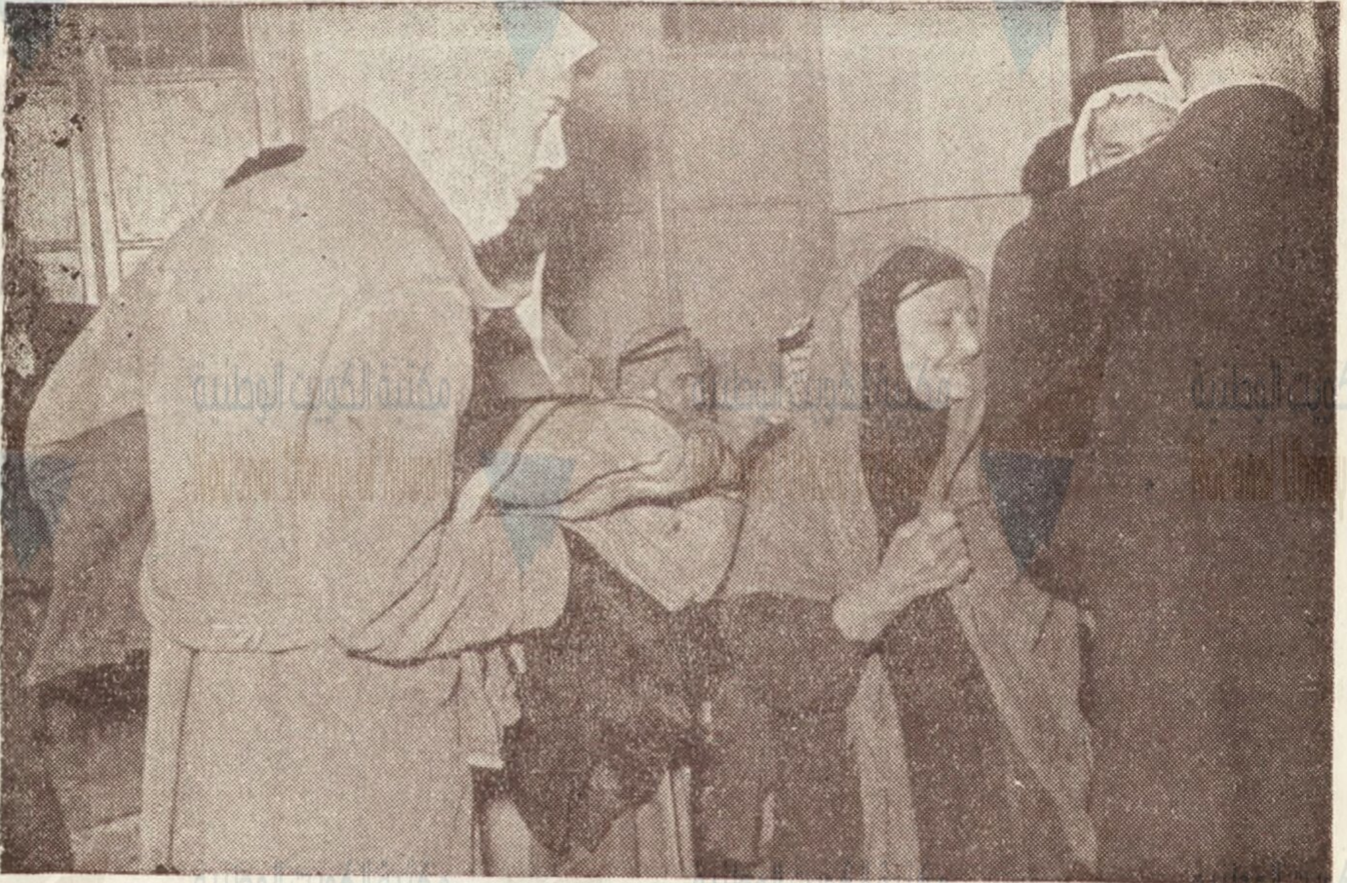
لاجئة وولدها وقد بدا عليها التأثر لعطف إخوانهم عليهم وقد كرمهم في محنتهم