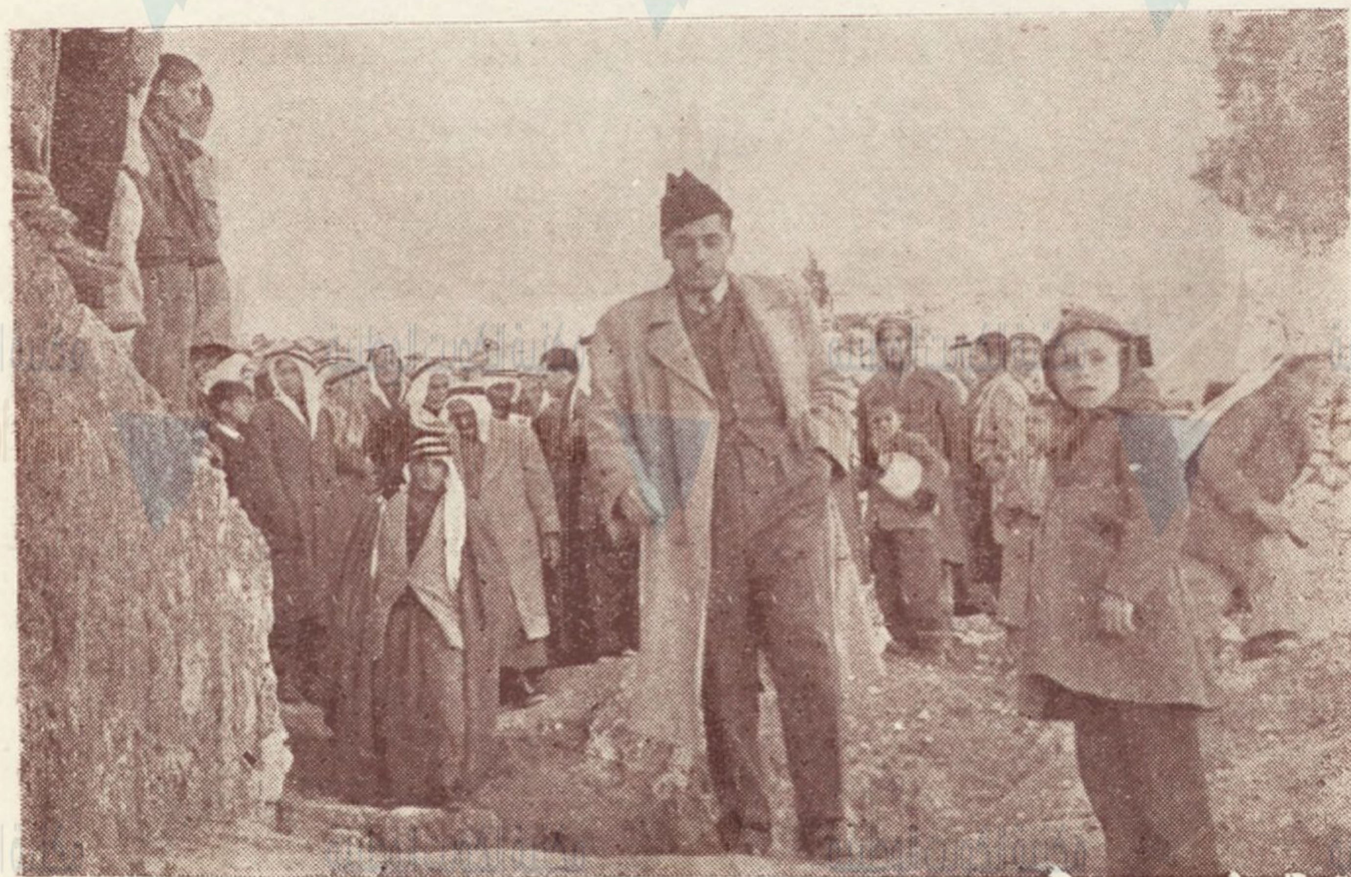
البعثة وهي تودع قرية صور باهر المجاهدة