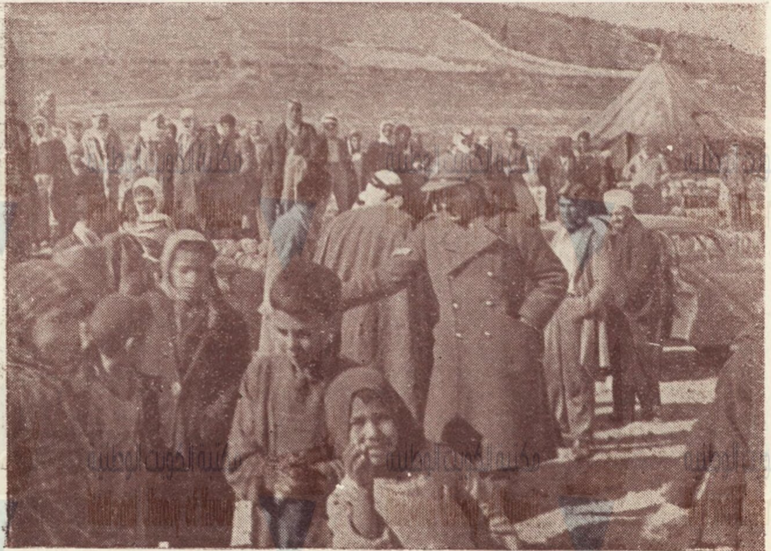
البعثة في مخيم عين السلطان - منطقة الغور -

هذه الأرض مرتع لليهود سلبت عزها أكف القروء وطغاة مستعمرين أباحوا كل حر لداميات القيود كيف نقضي على الدنية والعار ، وفي البرد كهرياء الجدود كيف نعفي وفي القلوب جراح ، فاغرات والفرد رهن الحديد ثم نبكي قساوة الظلم والسجن ، وشتى وسائل التشريد إنما الدمع والنحيب سلاح ، للضعيف الدليل لا للأسود .. الضحى صفعة الضياء على الليل وملجى الشريد والمنكود الضحى زعقة الشعوب على الطاغوت والظلم والشقاء المبيد الضحى صرخة الأباة من الشعب على ذابح القطيع العنيد الضحى زغردات ركب مجد ، هب من وحشة التراث المجيد الضحى نحن نسجها فدمانا كحلت مقلة الزمان البعيد الضحى فميا الكهبي المشوانا ، ولا مشوى بمجدنا المهدود في غد تعزف الرياح مع الفجر أهازيح نصرنا الموعود