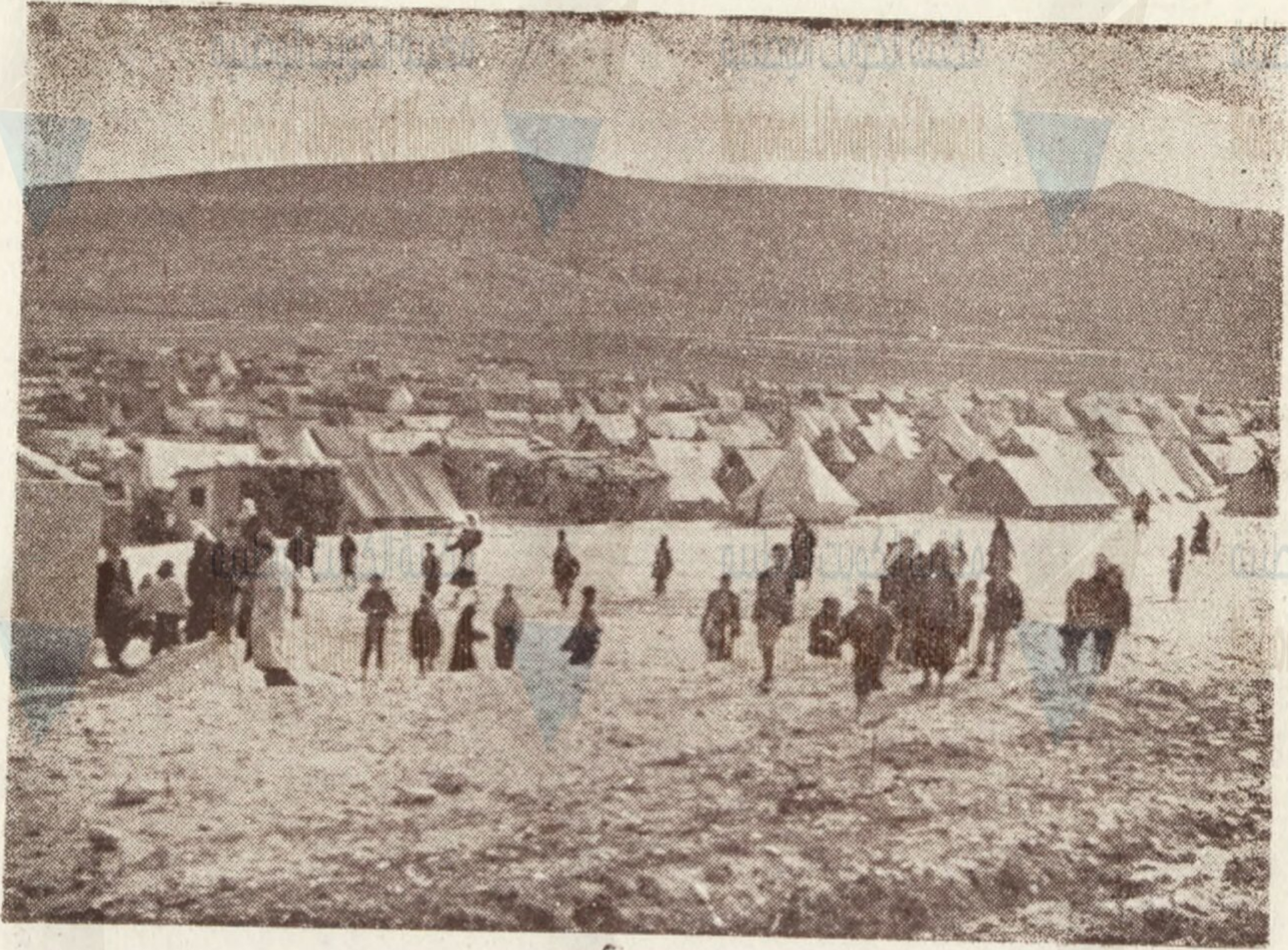
البعثة في مخيم الكرامة في منطقة الغور