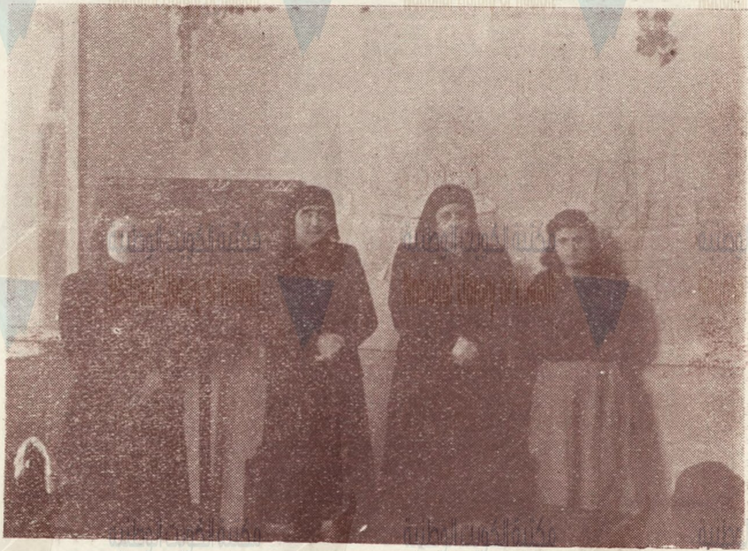
مديرة ومدارس دار الطفل بنابلس

مكتبة الكشوف وتسلم التبرعات مكتبة الكويت الوطنية