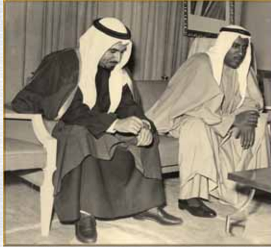
جلسة وتشاور بين سمو الأمير وسمو الشيخ سعد

وكان لسموه في مرحلة إعادة البناء والتعمير ما أثار الإعجاب والتقدير من دقة في التخطيط وسرعة في التنفيذ على نحو أزال عن الكويت الكثير من آثار المحن والأخطار .