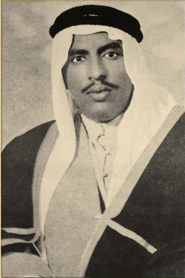
سمو الشيخ سعد العبدالله في شبابه